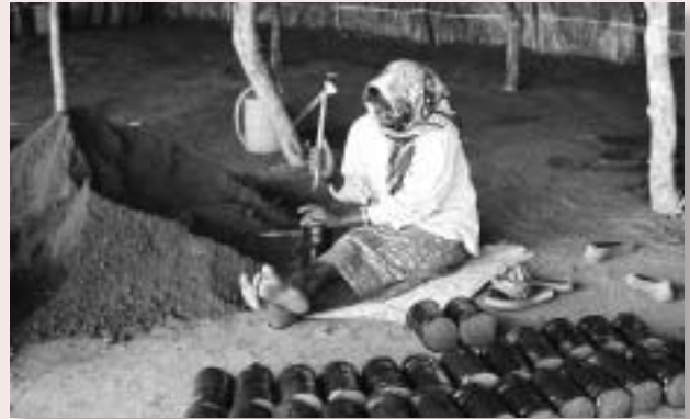
苗床を作るスーダン難民の女性

たとえばエチオピア西部、アソサ近郊にあるシャコレ難民キャンプでは、昨年1年間で、13種類、計約57万1000本の苗木を植えたところ、その約8割に根がついた。実際、植林が成功した地域に行くと、茶色い広大な土地の中に、突如として草木がかたまっ生えている。一方、同じエチオピアでも東部のジジガでは、厳しい半砂漠気候と土壌の質も影響して、