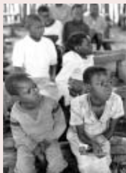
—表紙写真— 過去の記録写真から

◀メイン (モノクロ) ザンビアの定住地にいるモザンビーク難民。難民の子どもの初等教育はUNHCRの主な事業のひとつである。 1988年