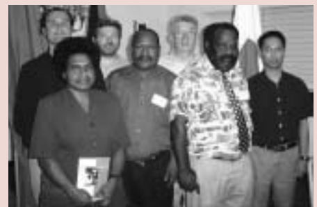
eセンターがサポートした不測事態対応計画立案の ワークショップ（パプアニューギニア）

他にもパプアニューギニアは、1951年 「難民条約」に調印するとともに、庇護希 望者や難民の問題に対応する法的かつ実務 的な枠組みを整備するなど、近年、難民が 到着した際の対応を改善すべく措置をとっ ています。現在では新たな難民法の草案が 進んでおり、今年中の施行に期待が高まっ ています。2003年2月に首都ポートモレス ビーでUNHCRの事務所が再開されたこと も大きな動きです。こうしたプロセスを通 じて、パプアニューギニアでの難民救済に 向けて準備は一段と整えられつつありま す。