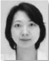
UNHCR日本・ 韓国地域事務所 法務補佐