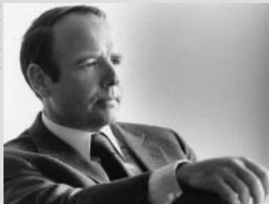
サドルディン・アガカーン(1974年)