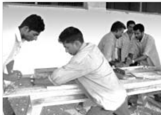
マナーラの木工技術コースで学ぶ訓練生たち。

私は今年の4月からスリランカ事業に関わりました。4月と6月の計2か月間の現地訪問で、政府関係局との覚書締結の準備や物資調達など、職業訓練事業を始めるための基盤作りを行ってきました。7月からは家族と共にスリランカに滞在しています。日本国内やミャンマー、アフリカでの私自身の職業訓練の経験を基に、単に技術を教える訓練ではなく、技術を通してお互いが学びあい、信頼される技術と人の育成をめざしたBAJ流職業訓練を現地で行っていきます。