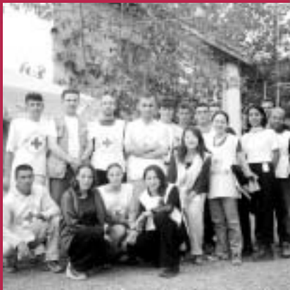
アルバニア系のマケドニア難民がコソボに逃れてきた2001年春。一緒に活動したコソボ赤十字社のボランティアとともに。前列、右から4番目が筆者。