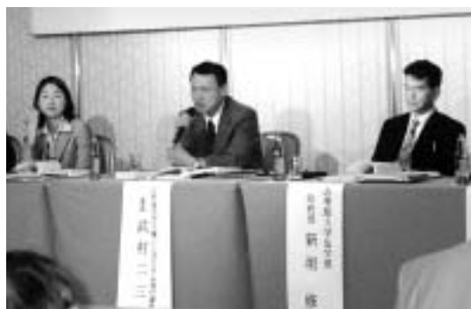
最近開催された弁護士の研修会でもZ事件が紹介されました。

被告が控訴したため、Z事件判決は確定しておらず、今後の司法の動向が注目されます。また、国家賠償請求事件という性質もあってか、東京地方裁判所の判決は、立証基準、適正手続、条約難民の解釈までは踏み込んでおらず、これらは日本の難民司法の課題として残されたままです。ただ、今回の判決の内容が、日本の認定者が行うべきことを再考する上で価値を持つことは間違いのないでしょう。