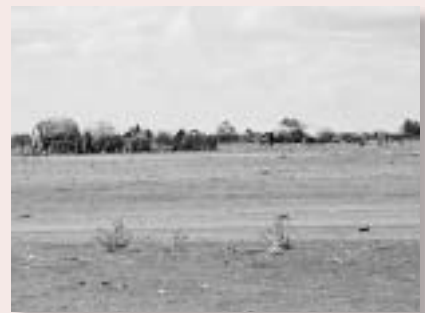
伐採によって樹木が消えたソマリア難民キャンプ

いずれにしても、一度破壊された自然環境を修復するには長い年月と膨大な資金、継続的な努力が必要だ。難民を受け入れてくれる社会の人々と難民たちとの平和的な共存のためにも、自然環境の保護は大きな課題である。