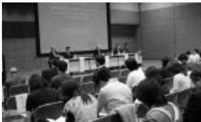
当日は、認定された難民や弁護士、研究者、学生などが参加した。

韓国の難民認定に関する法律は、日本の「出入国管理および難民認定法」をモデルに策定されています。その結果、難民認定制度も、制度が抱える課題も共通点が多いのが現状です。不法滞在者の取り締まりを任務とする入国管理局が、しばしば不法滞在者となってしまう庇護希望者の人権を保護する役目を負うという難しさを抱えていること。また不服審査機関が第一次審査機関と同一であるという非独立