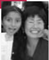
特定非営利活動法人 難民支援協会 (JAR) 調査員