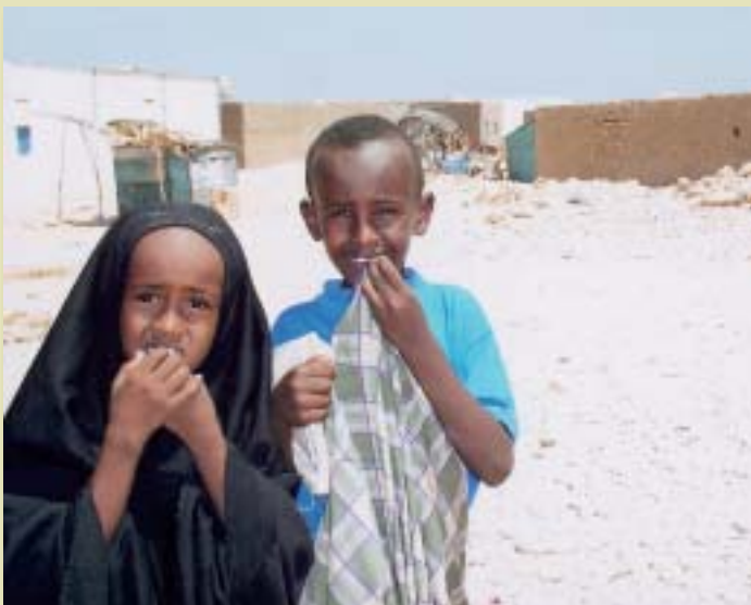
ソマリアに戻った子どもたち

「私たちは、国際社会の関心が すぐにアフリカから離れてしまうことを 痛いほど感じています。」