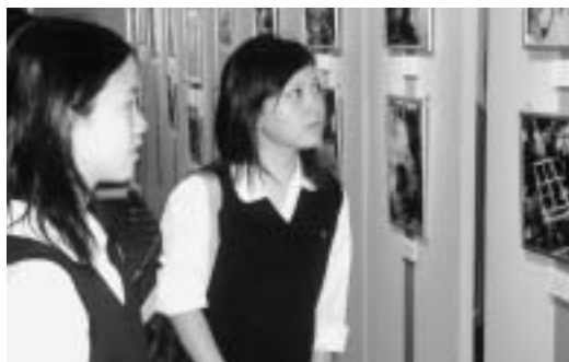
「世界難民の日」展を見学する高校生。

私は多くの難民キャンプを訪れたが、粗末な教室で勉強する若い人々の強烈な熱意にいつも心打たれてきた。勉強することが難民キャンプから抜け出す唯一の方法だからである。彼らは未来の希望をあきらめていない。私たちも、この希望を彼らに与えないわけにはいかない。彼らの未来は、私たちの未来でもあるからだ」。