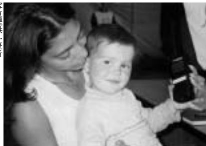
UNHCRの職員と遊ぶマケドニア難民の子ども。