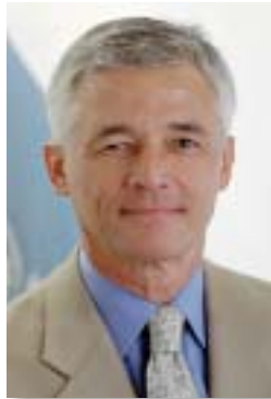
故ピエラデメロ国連事務総長 特別代表

犠牲者の一人となったセルジオ・ピエラデメロ国連事務総長特別代表(55歳)は長年、外交官、そしてベテラン国連職員として活躍してきた。1969年、UNHCRで国連職員としてのキャリアを開始し、アフリカ、ラテンアメリカ、ヨーロッパ、アジア各地で勤務。96年には難民高等弁務官補に任命された。その後、UNHCRを離れ国連事務総長の代理として、紛争後のカンボジア、ルワンダ、コソボ、東ティモールなど多くの地域で功績を残している。その