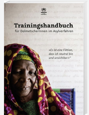
UNHCR ÖSTERREICH Trainingshandbuch für DolmetscherInnen im Asylverfahren 1. Aufl. 2016, 194 Seiten, A4, Softcover ISBN 978-3-99033-605-2 Art.-Nr. 20186151 EUR 34,90