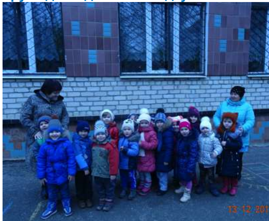
Група дітей дитячого садку