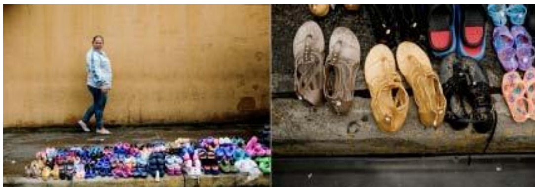
ACNUR. Costa Rica

La confidencialidad es un término que indica que la preservación de la privacidad de las personas que reciben asistencia. Esto significa que toda la información relacionada con ellos se mantendrá en estricta confidencialidad para su uso exclusivo por parte del equipo de proveedores de atención. Esto incluye la información obtenida verbalmente o de registros de los clientes.