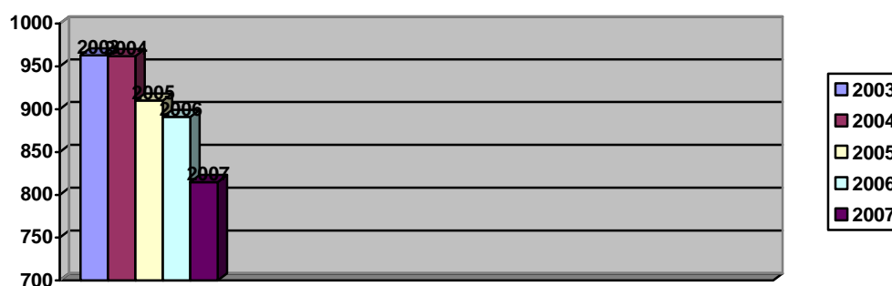
Таблица 21 Общее число умышленных убийств 26

94. За последние пять лет в Республике отмечена тенденция снижения общего числа умышленных убийств : если в 2003 и 2004 годах было зарегистрировано 963 и 962 убийства соответственно, то в 2005 году было зарегистрировано 910 случаев. В 2006 году зарегистрировано 891 случай, что в сравнении с 2005 годом – на 5,4% меньше, в 2007 году – 815, что в сравнении с 2006 годом меньше на 5,3%.