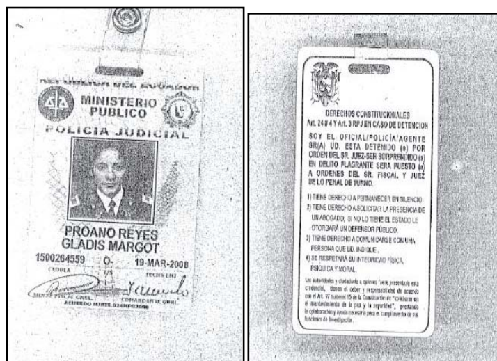
Рис. 3 Карточка с указанием прав задержанного лица

85. С другой стороны, задерживаемое лицо до помещения в центр содержания под стражей или полицейский участок осматривается дежурным врачом медицинского пункта или соответствующим работником в составе национальной полиции или прокуратуры. В свою очередь Министерство внутренних дел предписало национальной полиции в незамедлительном порядке препроводить всех задержанных на месте преступления лиц в государственное медицинское учреждение для проведения медицинского осмотра с целью обеспечения их прав человека.