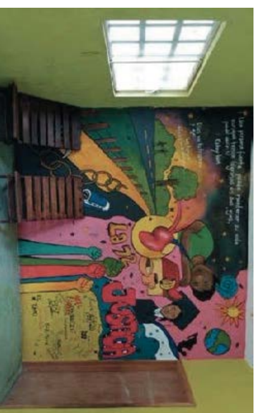
Mural en el albergue La 72, Tenosique, MX