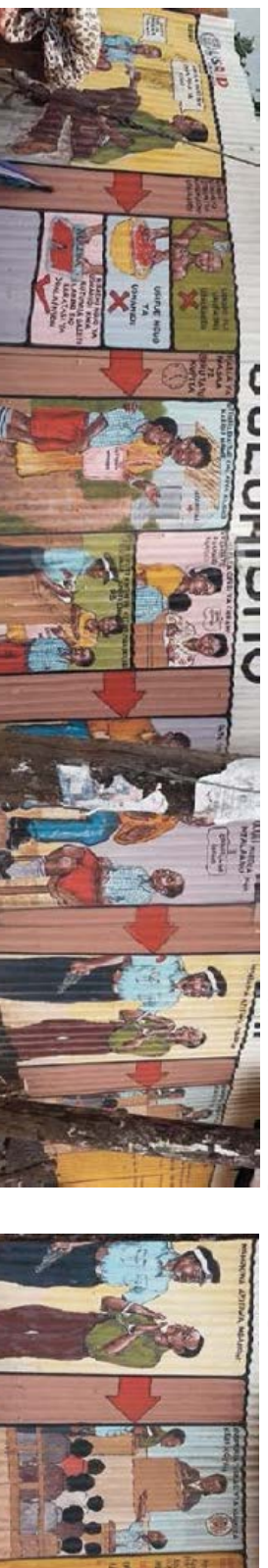
Murales sobre VSG de CREAW en Kibera, Nairobi, Kenia.

Además de crear afiches específicos sobre VSG, el equipo investigador propone expandir el uso de murales en este contexto de desplazamiento para incluir mensajes sobre VSG. Un ejemplo interesante de sensibilización entorno a la VSG proviene de Kenia, donde el Centro para la Educación y Concientización sobre los Derechos (CREAW, por sus siglas en inglés) instaló murales educativos en toda la zona marginal de Kibera, Nairobi. Dispersos por todo el vecindario, estos murales representan diferentes escenarios relacionados con la VSG (diferentes formas de daño, diferentes grupos de víctimas). El panel final de cada mural indicaba dónde las personas sobrevivientes podían obtener servicios de apoyo o buscar asistencia policial, incluidos los números de teléfono. Esta aproximación a la sensibilización era colorida, fácil de entender y altamente visible para todas las personas de la comunidad.