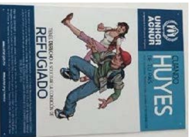
Afiche de ACNUR

La investigación de campo reveló varias formas en que las áreas comunes ya se usaban para comunicar información sobre la migración o el proceso de asilo. Por ejemplo, el equipo investigador observó lo siguiente: