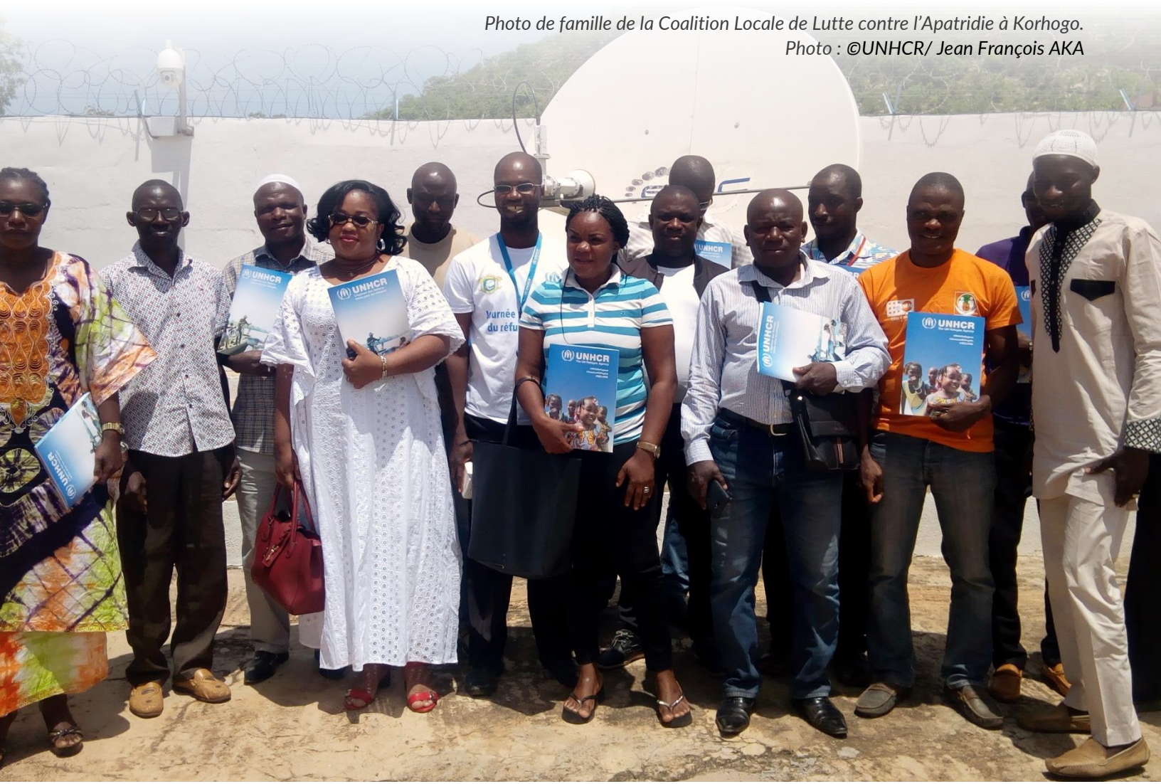
Photo de famille de la Coalition Locale de Lutte contre l'Apatridie à Korhogo.

DOROPO : Le sous-préfet de Doropo et le HCR ont mis en place 15 comités de lutte contre l'apatridie dans la région. Ces comités militent en faveur de la déclaration des naissances et des décès. Ils favorisent un climat de paix et de protection dans les communautés, en mettant en avant les droits de l'Homme et la cohésion sociale.