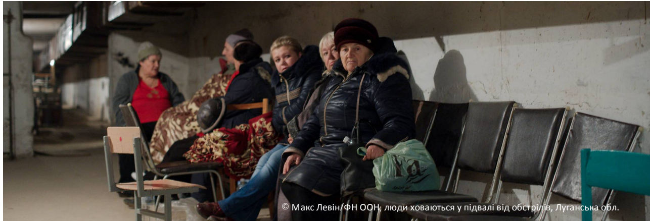
© Макс Левін/ФН ООН, люди ховаються у підвалі від обстрілів, Луганська обл.

КЛАСТЕР З ПИТАНЬ ЗАХИСТУ ВКЛЮЧАЄ СУБ КЛАСТЕРИ З ПИТАНЬ ЗАХИСТУ ДІТЕЙ, ГЕНДЕРНОГО НАСИЛЬСТВА ТА РОЗМІНУВАННЯ