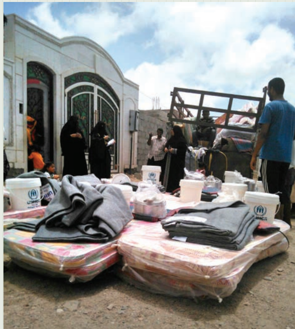
Distribution d'articles de secours, y compris matelas et couvertures, en faveur des déplacés au Yémen.

Le HCR a déclaré vendredi (3 juillet) avoir réussi à livrer du matériel d'aide humanitaire aux personnes déplacées au Yémen en mai et juin malgré de sévères restrictions sur l'accès.