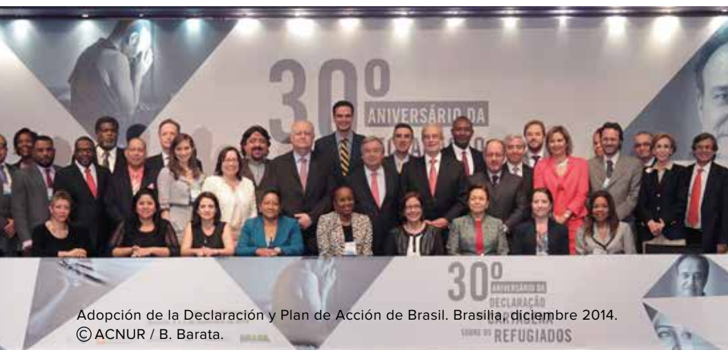
Adopción de la Declaración y Plan de Acción de Brasil. Brasilia, diciembre 2014.

En noviembre de 2014, el ACNUR lanzó la campaña #IBelong 2 con miras a erradicar la apatridia en el mundo antes de 2024. Con este propósito, y en consulta con los Estados, la sociedad civil y las organizaciones internacionales, el ACNUR desarrolló el Plan de Acción Mundial para Acabar con la Apatridia (“Plan de Acción Mundial”) 3 , proponiendo un marco estratégico comprensivo de diez acciones para resolver situaciones existentes de apatridia, prevenir el surgimiento de nuevos casos de apatridia, e identificar y proteger mejor a las personas apátridas 4 .