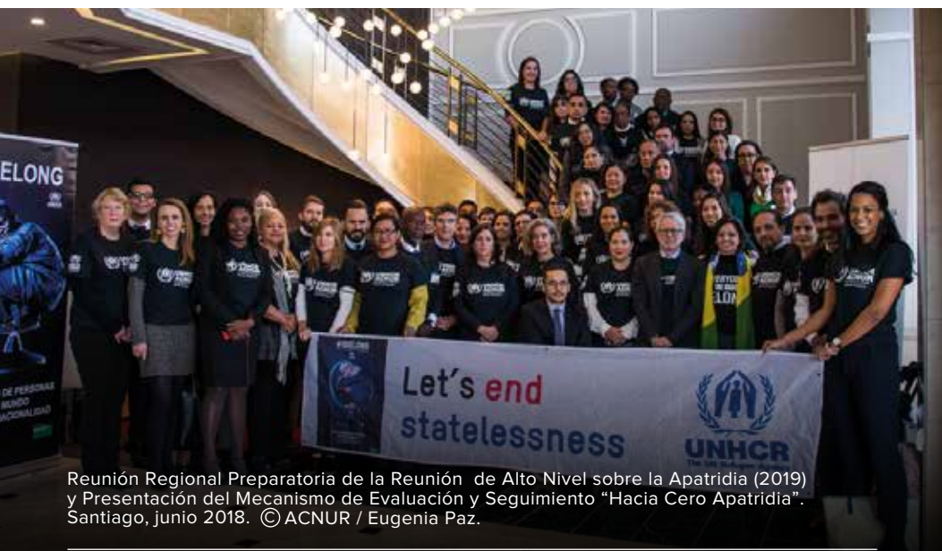
Reunión Regional Preparatoria de la Reunión de Alto Nivel sobre la Apatridia (2019) y Presentación del Mecanismo de Evaluación y Seguimiento "Hacia Cero Apatridia". Santiago, junio 2018.