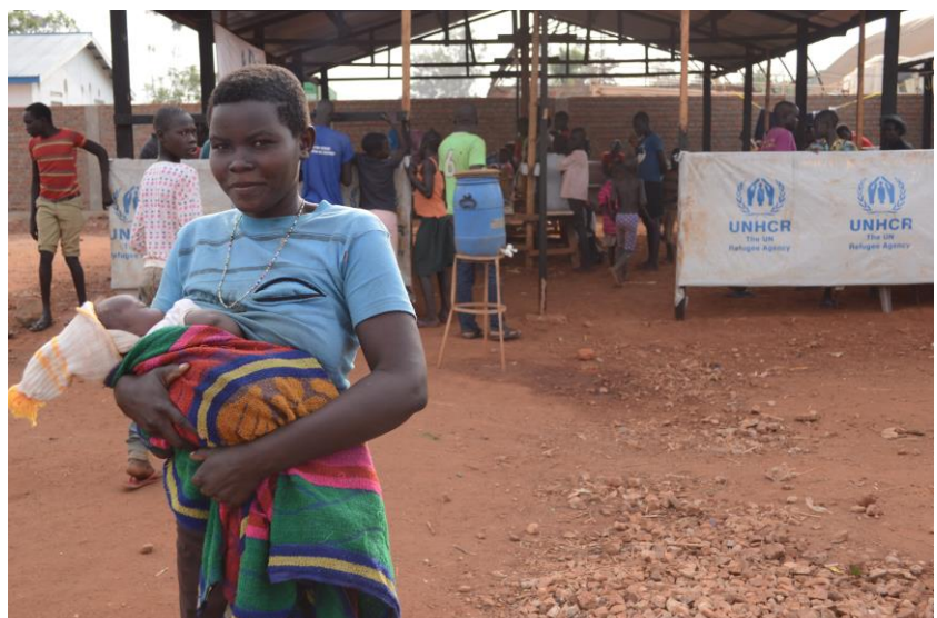
Nouveaux réfugiés sud-soudanais arrivés en Ituri.