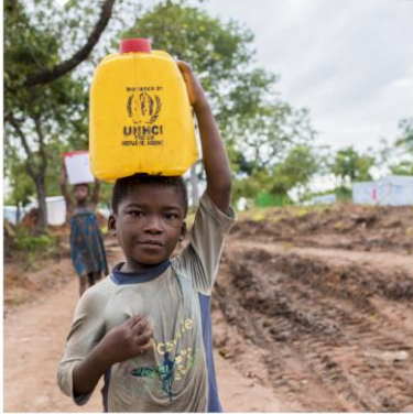
CAMEROON SITUATION RESPONDING TO THE NEEDS OF IDPs AND CAMEROONIAN REFUGEES IN NIGERIA

Supplementary Appeal January - December 2019