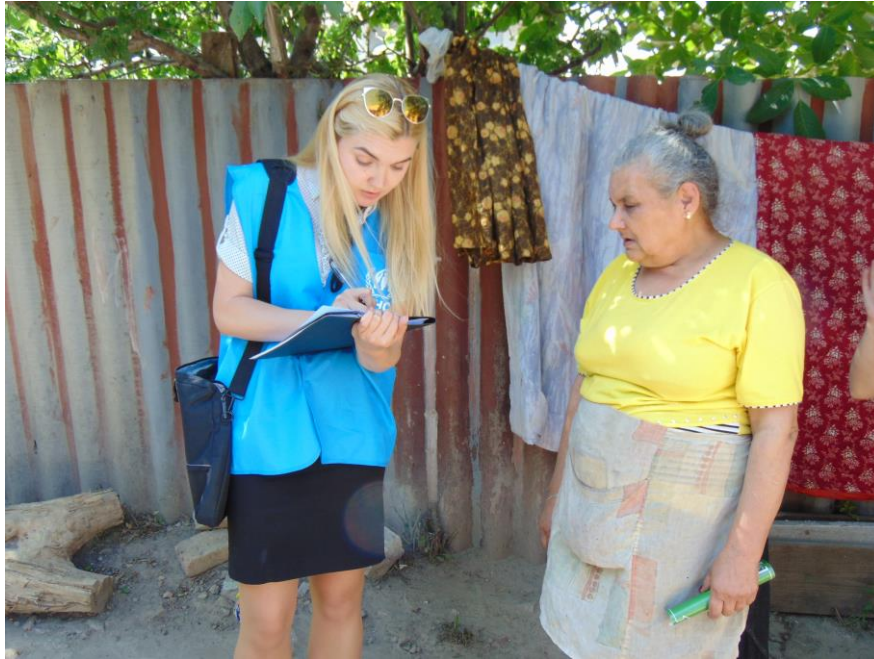
Юрист ГО «Десяте квітня», партнера UNHCR, спілкується з представницею ромської сім'ї у селі Корсунці Одеської обл. з метою надання правової допомоги.