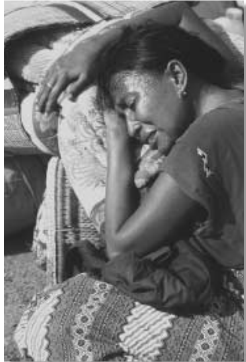
クバンから東ティモールへの帰還民。民兵などの破壊行為によって、戻るべき家を失った人々が多い。

この号では、ティモールで展開してきたUNHCRの活動と今後の予定について報告する。