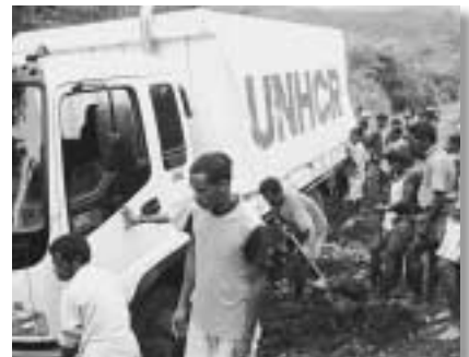
移送トラックがぬかるみにはまり、立ち往生してしまうことは多い。帰還民は、その度に木や石を集めて道を直し、家路を急ぐ。

新しい国作りは、難民の帰還なくしては始まらない。彼らの帰還を促進し、安心して生活のできる環境作りは「東ティモール独立」の第一歩なのだ。