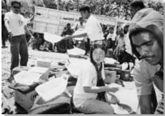
中央で座っているのが筆者。

オイキシという地名にピンと来なかったのは私の勉強不足なのだが、東ティモールに飛び地があることを知ったのは現地事務所へ派遣される直前のことだった。