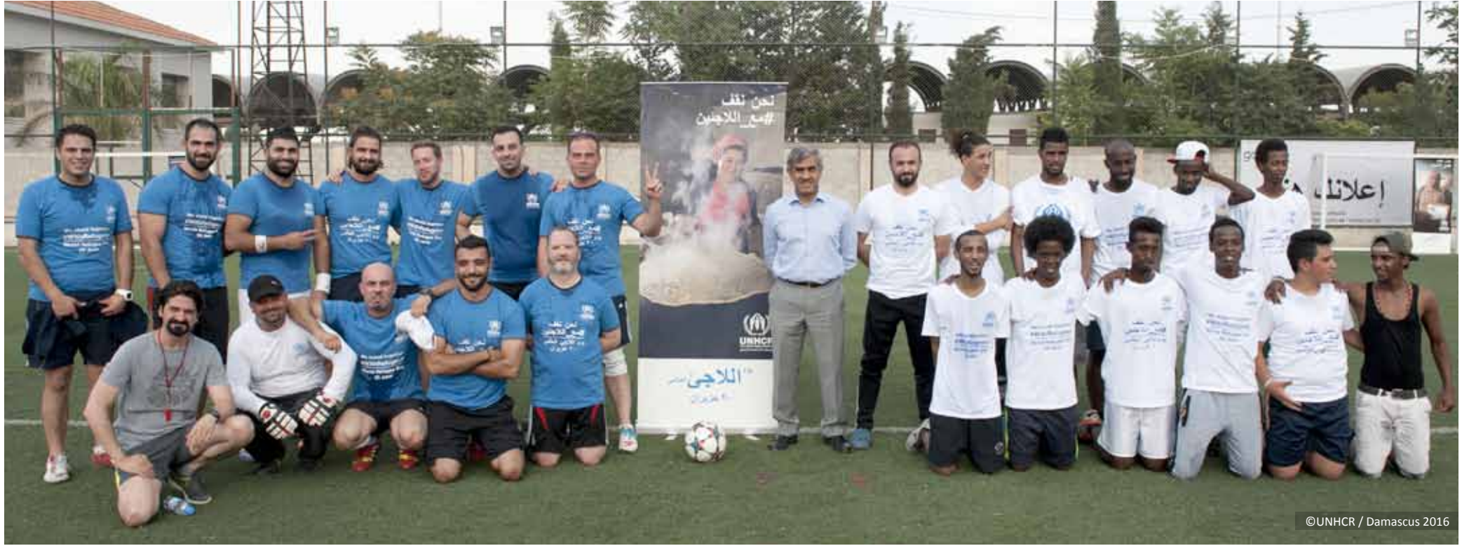
Damascus 2016

كما احتفل العاملون في المفوضية في دمشق بهذا اليوم عن طريق إقامة مباراة كرة قدم ودية جمعت بين موظفين من وكالات الأمم المتحدة في سورية ولاجئين من الصومال والسودان والعراق.