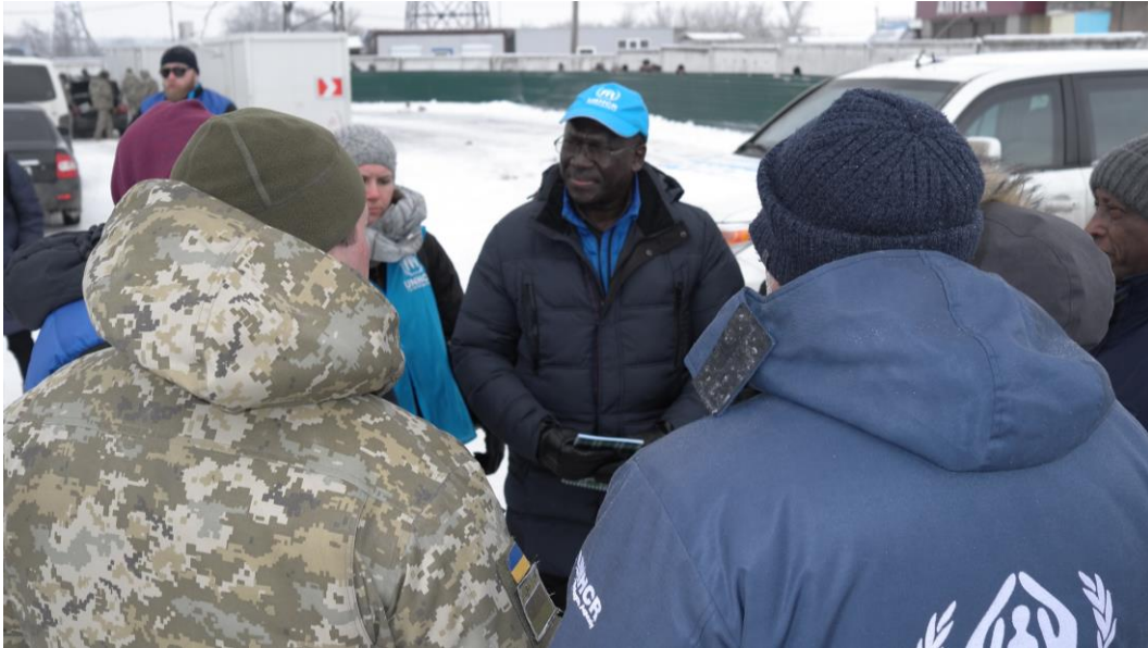
Пан Джордж Окот-Оббо, заступник Верховного комісара УВКБ ООН з питань операцій, на зустрічі з офіцерами Державної прикордонної служби України на КПВВ «Майорськ», що на лінії розмежування, протягом робочого візиту на схід України.