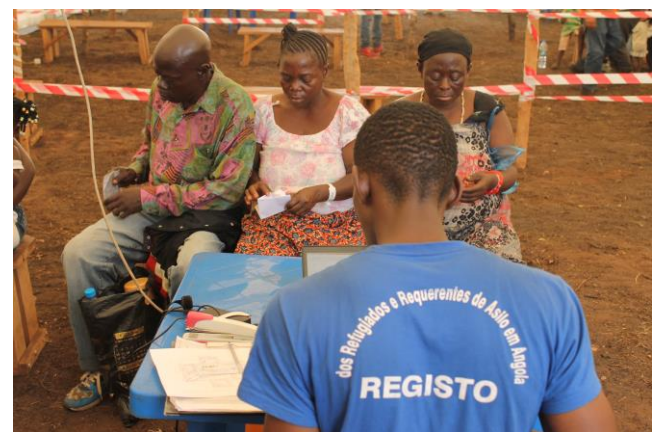
Registo de uma família após chegada ao novo assentamento de Lóvua.