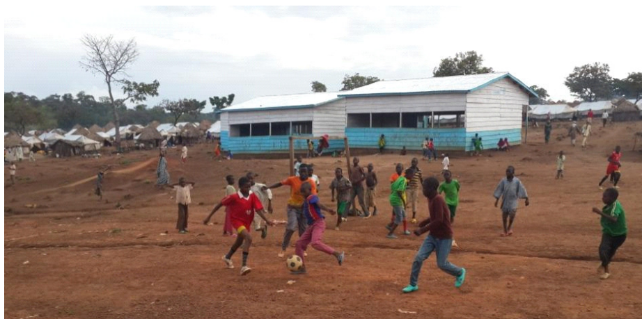
Les enfants réfugiés et ceux du village Borgop jouant au football sur le site de Borgop.