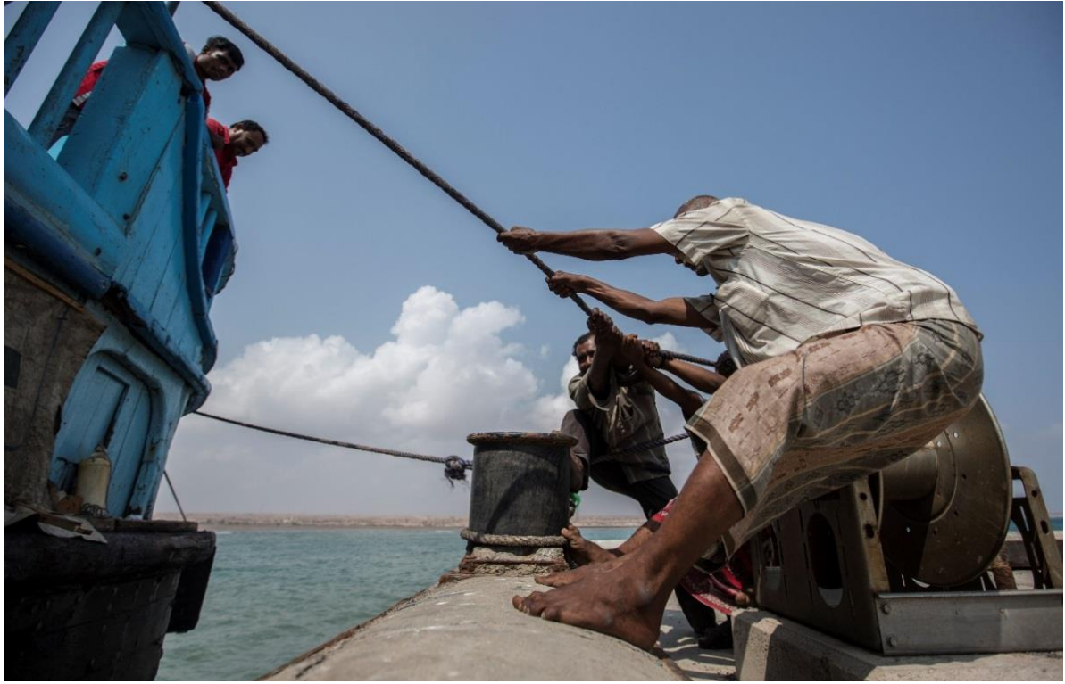
جيبوتي. يشغل القارب طاقم هندي يتقاضى ما بين 100$ و150$ للشخص لرحلة باتجاه واحد من عدن في اليمن إلى جيبوتي.

إن الوصول إلى المستفيدين لإعلامهم بمخاطر التنقل وتوفير المساعدة والحماية لهم، هو تحدٍ متوقع في سياق تحركات الهجرة المختلطة التي تؤثر على المنطقة.