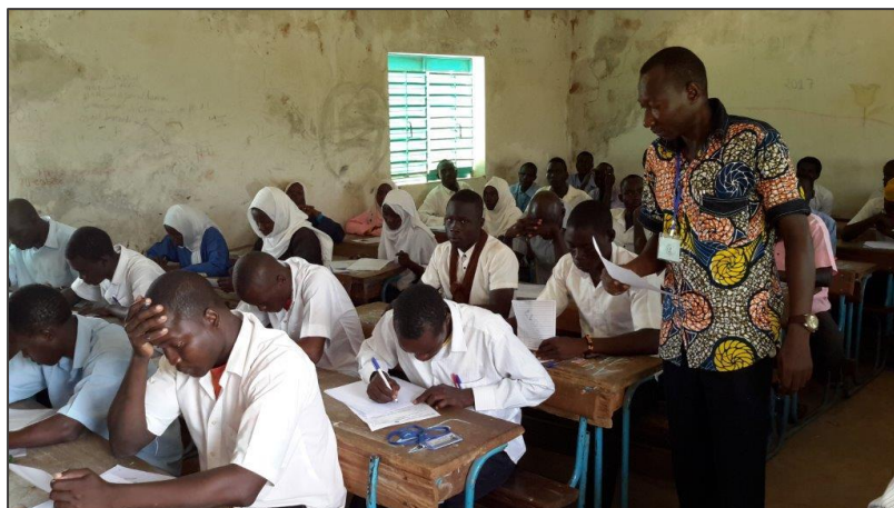
Une salle du centre d'examen de Goz Beida où 140 élèves réfugiés des camps de Djabal (situé à moins d'1 Km) et Goz-Amir (situé à 55 Km) passent le BAC.

humain qui est en difficulté. C'est ce que vous faites, les humanitaires » a-t-il déclaré s'adressant au Représentant du HCR et sa délégation.