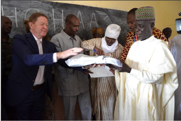
Le Représentant par intérim du HCR remettant les feuilles de la première épreuve au responsable du centre d'examen tandis que le Préfet son enveloppe, bien scellée.