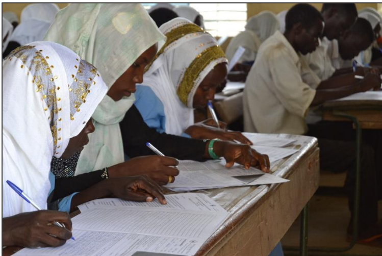
La présence majoritaire des filles a été saluée comme un signe de promotion de la gence féminine par le Préfet.

Edward O'Dwyer a remercié « le gouvernement et le peuple tchadien pour l'accueil accordé aux réfugiés depuis plus d'une décennie et pour les démarches entreprises en faveur de l'inclusion socio-économique, qui commence par l'éducation ».