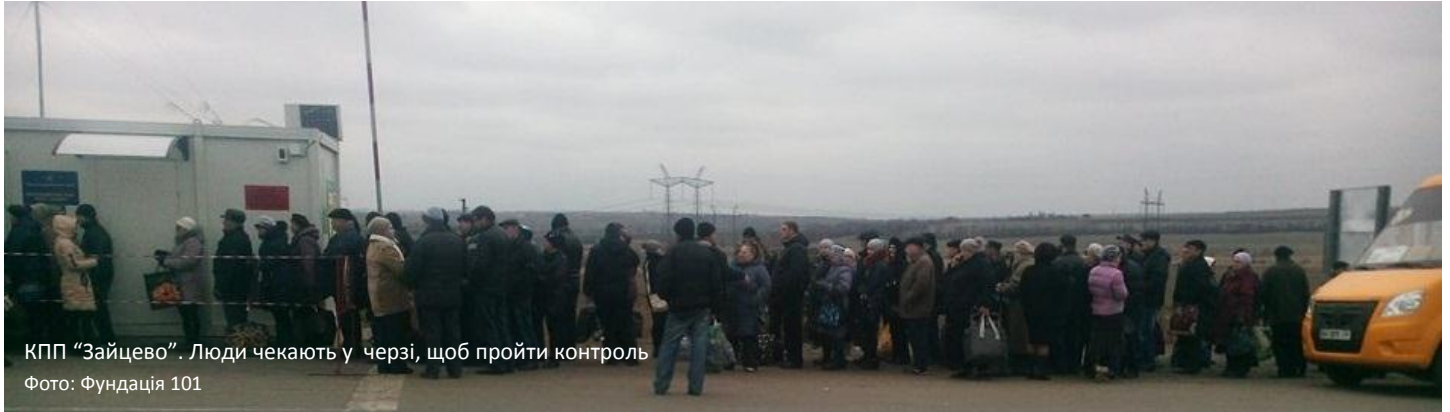
КПП "Зайцево". Люди чекають у черзі, щоб пройти контроль