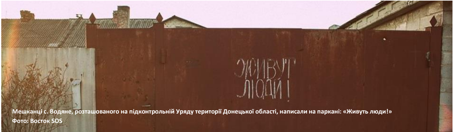
Мешканці с. Водяне, розташованого на підконтрольній Уряду території Донецької області, написали на паркані: «Живуть люди!»

ДО КЛАСТЕРУ З ПИТАНЬ ЗАХИСТУ ВХОДЯТЬ СУБКЛАСТЕРИ З ПИТАНЬ ЗАХИСТУ ДІТЕЙ, ҐЕНДЕРНОГО НАСИЛЬСТВА ТА РОЗМІНУВАННЯ