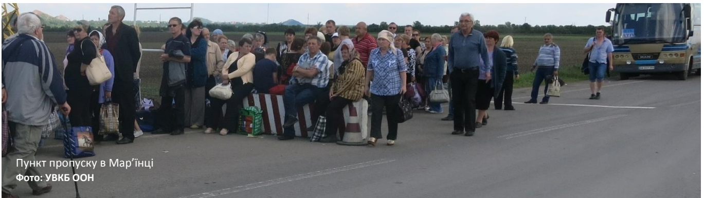
Пункт пропуску в Мар'їнці