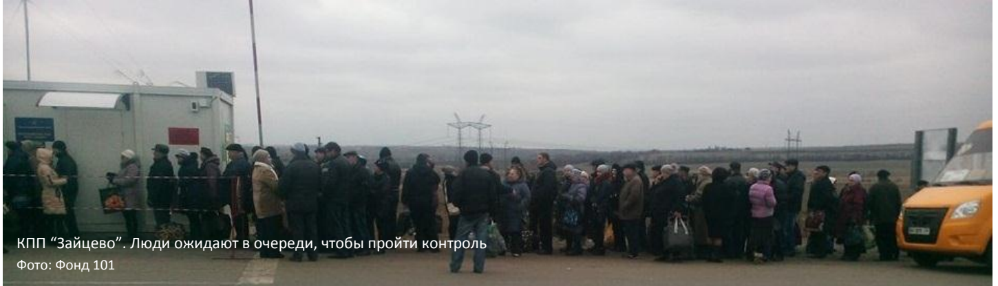
КПП "Зайцево". Люди ожидают в очереди, чтобы пройти контроль

КЛАСТЕР ПО ВОПРОСАМ ЗАЩИТЫ СОСТОИТ ИЗ СУБ-КЛАСТЕРОВ ПО ВОПРОСАМ ЗАЩИТЫ ДЕТЕЙ, ГЕНДЕРНОГО НАСИЛИЯ И РАЗМИНИРОВАНИЯ