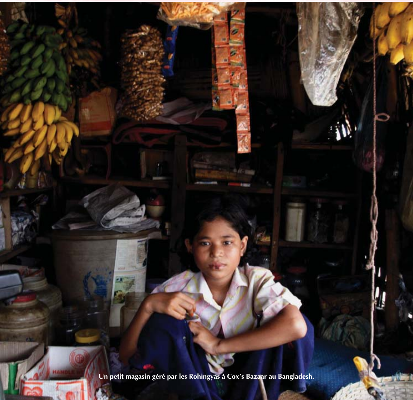
Un petit magasin géré par les Rohingyas à Cox's Bazaar au Bangladesh.