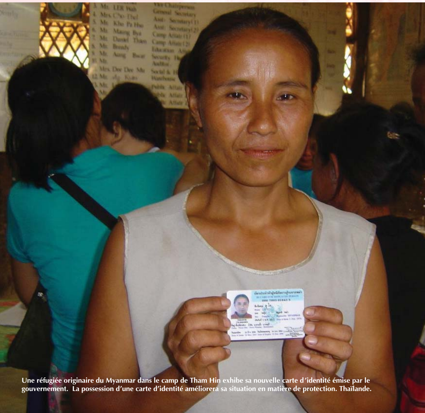
Une réfugiée originaire du Myanmar dans le camp de Tham Hin exhibe sa nouvelle carte d'identité émise par le gouvernement. La possession d'une carte d'identité améliorera sa situation en matière de protection. Thaïlande.