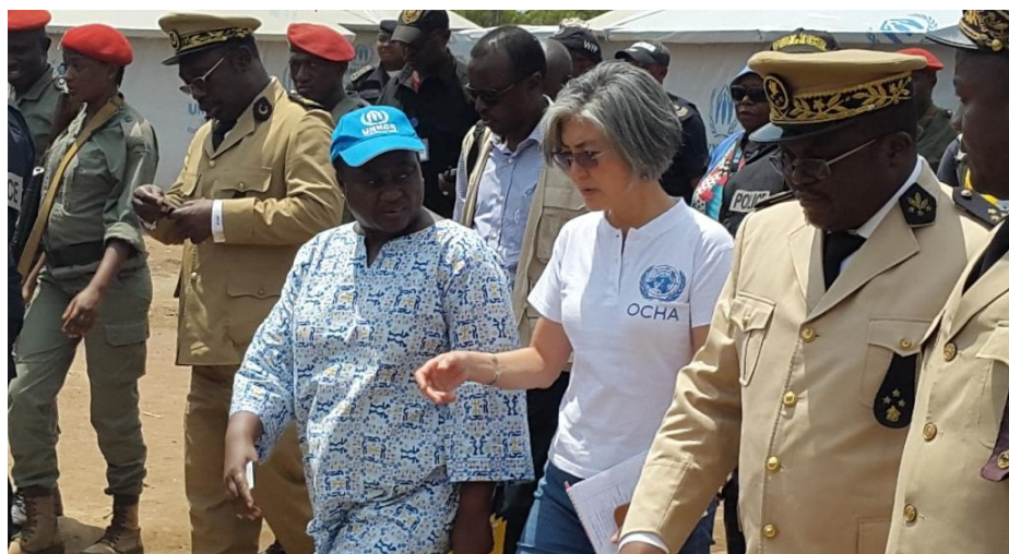
Madame Kang visitant le site de réfugiés de Gado, en compagnie du Gouverneur de la région de l'Est et de la Représentante du HCR.