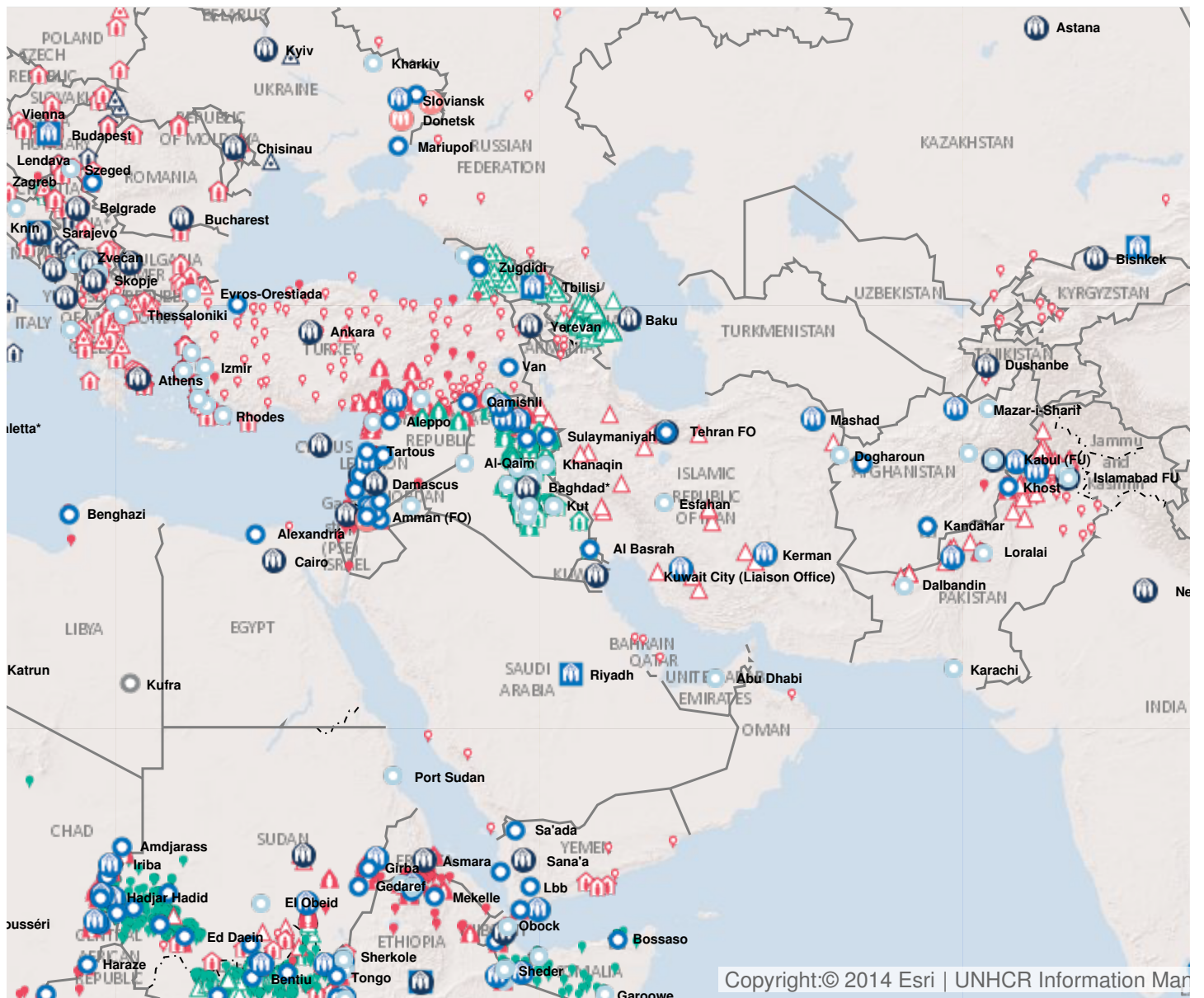
Latest update of camps and office locations 21 Nov 2016.

| Arabie saoudite | Bahreïn | Émirats arabes unis | Iraq | Israël | Jordanie | Koweït | Liban | Oman | Qatar | République arabe syrienne | Yémen |