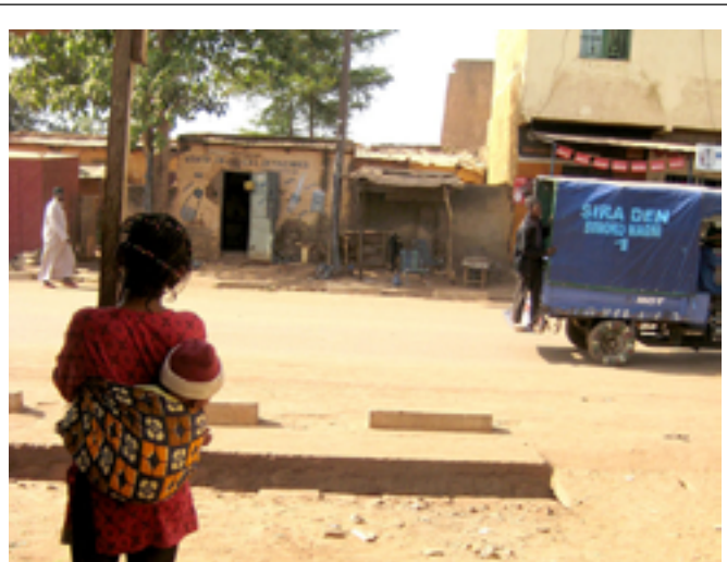
Jeune fille déplacée de Tombouctou à Bamako avec sa grand-mère, ses parents et trois frères et sœurs. Bien qu'ils vivent dans de mauvaises conditions dans la capitale, ils attendent l'amélioration des conditions de sécurité et l'ouverture des écoles pour retourner.

Alors que la situation sécuritaire reste problématique, le Mali se remet lentement de la crise déclenchée par l'occupation du nord du pays par des groupes armés islamistes en 2012. L'offensive militaire menée par la France en janvier 2013, la création en avril 2013 de la Mission multidimensionnelle intégrée des Nations Unies pour la stabilisation au Mali (MINUSMA) et la tenue pacifique des élections présidentielles et législatives dans la deuxième partie de l'année ont apporté une lueur d'espoir aux 353 000 personnes déplacées vivant encore dans des conditions extrêmement difficiles, permettant à beaucoup d'entre elles de se projeter dans l'avenir.