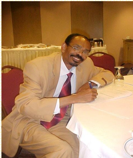
Shaandhaynta ka qaybgalka jaangooyada

Fadhiyada qorshaynta ayaa la qabanayaa iyadoo lagu diyaarinaayo Qorshe sanadeedka howlgalada wadanka (COP) si loogu gudbiyo xarunta UNHCR ee Geneva. Ka qaybgalayaasha waxaa ka mid ah deeq bixiyayaasha, dowladaha martigeliyay qaxootiga, NGO-yad fuliya mashaariicda UNHCR-ta, howl wadaagayaasha mashaariicda UNHCRta iyo dadka qaxootiga ah* 4 si wada jir ah. Waxay dib u falanqayn iyo dib u eegisba ku samaynayaan warbixinadda la horkeenay waxaana halkaas laga soo saari u jeedooyinka, hadafka la tiixsanayo heer dal.*5