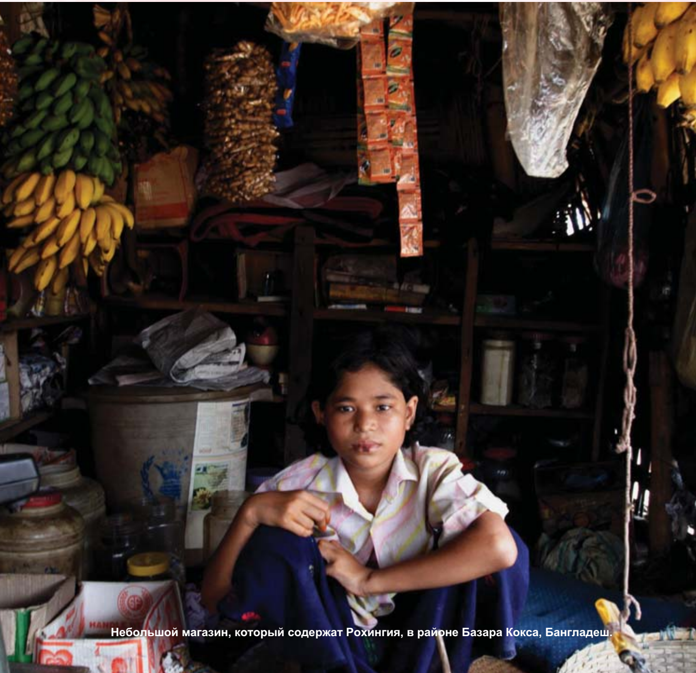
Небольшой магазин, который содержат Рохингия, в районе Базара Кокса, Бангладеш.