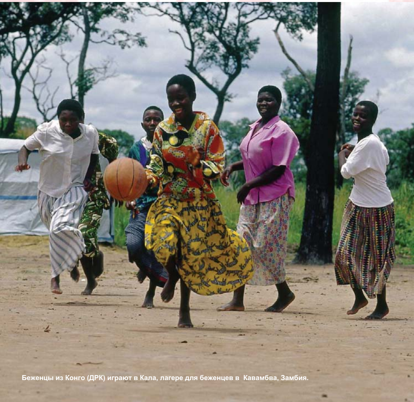
Беженцы из Конго (ДРК) играют в Кала, лагере для беженцев в Кавамбва, Замбия.