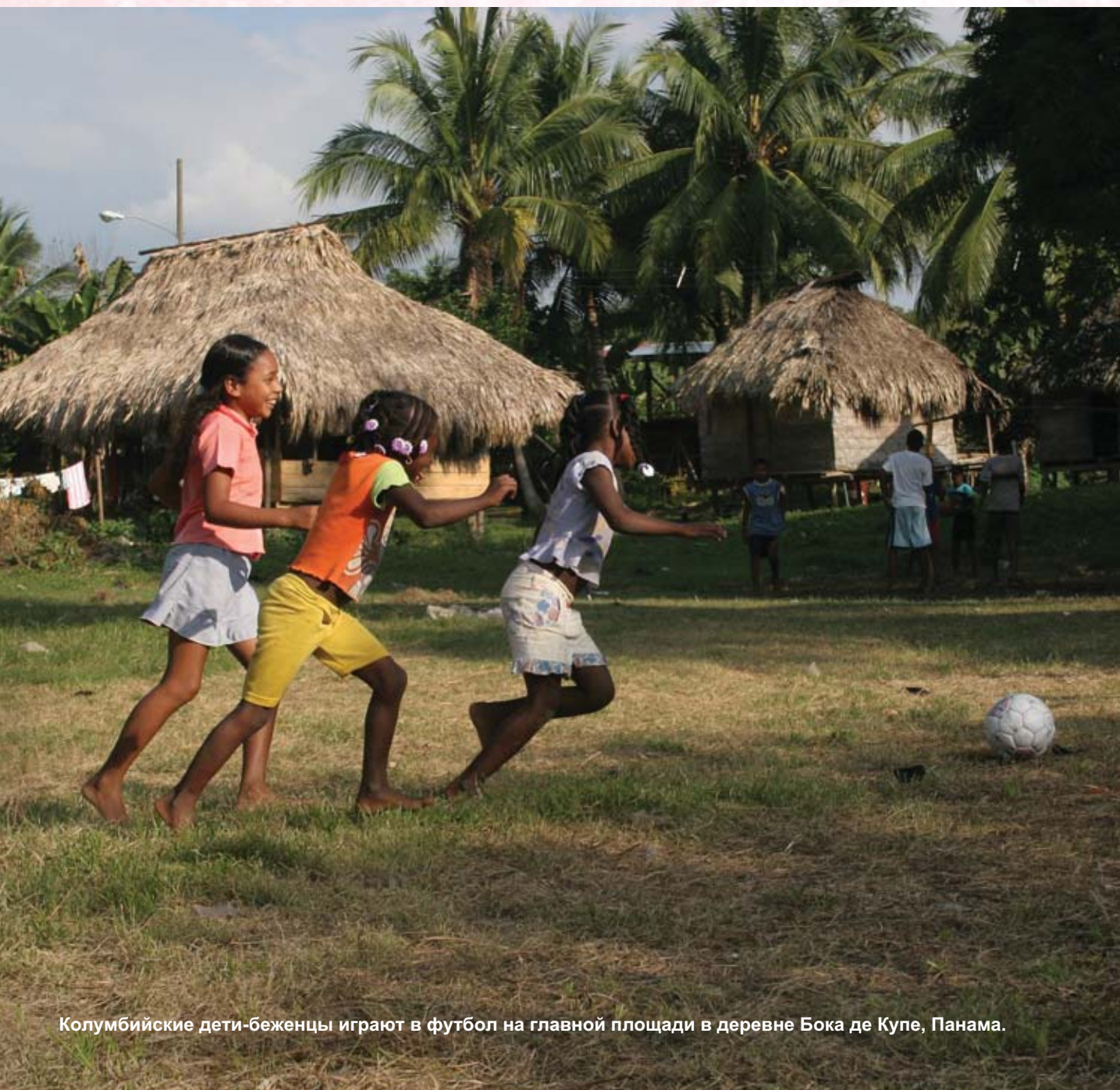
Колумбийские дети-беженцы играют в футбол на главной площади в деревне Бока де Купе, Панама.