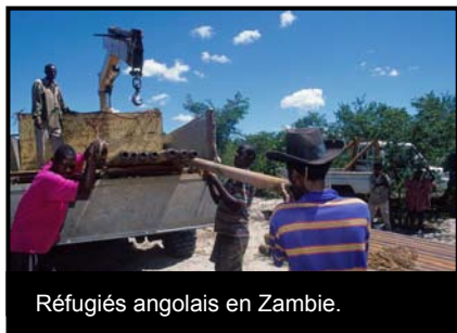
Réfugiés angolais en Zambie.

Elle vise à réduire la pauvreté par la reconstruction de la communauté, à accroître la production alimentaire, à combattre la dégradation de l'environnement et à améliorer les services sociaux fondamentaux et le niveau de vie. Elle vise en outre à réduire la pauvreté en intervenant dans les secteurs suivants : agriculture, santé, éducation et développement des compétences (notamment la formation professionnelle) mais également gestion des ressources naturelles et de l'infrastructure, dans leur ordre de priorité.