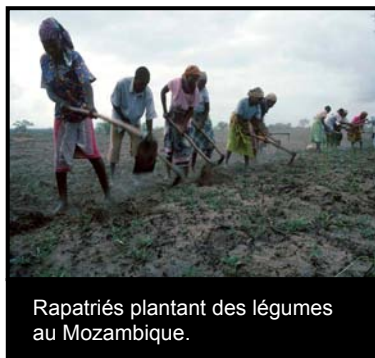
Rapatriés plantant des légumes au Mozambique.

La présente publication expose les conclusions de la conférence parlementaire régionale dont le thème était « Réfugiés en Afrique : défis en matière de protection et solutions », organisée conjointement par le Haut Commissariat des Nations Unies pour les réfugiés (HCR) et l'Union parlementaire africaine, à Cotonou au Bénin, du 1 er au 3 juin 2004. La conférence est née de l'invitation faite au HCR