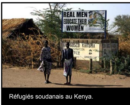
Réfugiés soudanais au Kenya.

Il convient également de mentionner la persécution sexiste. Par exemple, des femmes obligées de fuir pour des raisons politiques, ethniques ou religieuses, ou à cause de codes sociaux stricts mis en place par l'Etat ou des acteurs privés, ont le droit d'être protégées contre la persécution, au même titre que des victimes de violence sexuelle ou de viol. Un certain nombre de pays disposent de directives exhaustives en matière de persécution sexiste.