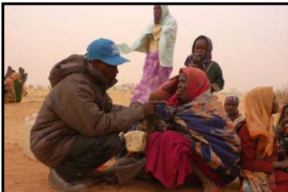
Volontaire du HCR aidant des réfugiées soudanaises au Tchad.

Cette conférence constitue donc une occasion unique d'entendre les points de vue des parlementaires de toute l'Afrique sur la façon de saisir les opportunités présentées par les processus de paix actuels en vue d'aider des millions de réfugiés et de personnes déplacées à retourner dans leur pays d'origine en toute sécurité et dans la dignité. Elle