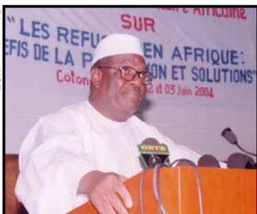
S. E. Monsieur Ibrahim Boubacar Keita, Président du Comité exécutif de l'Union parlementaire africaine.

Nous sommes, nous parlementaires, appelés à renforcer le rôle de nos Parlements respectifs en favorisant, d'une part, l'adhésion aux instruments de Droit International relatif aux questions humanitaires, aux réfugiés, et aux droits de l'Homme, et d'autre part, l'élaboration d'un système national de protection des réfugiés à travers la mise en place ou la modification d'une législation nationale selon les normes internationales et régionales établies.