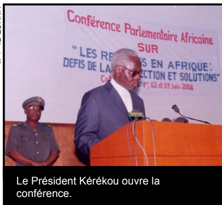
Le Président Kérékou ouvre la conférence.

S ur le sombre tableau général des maux qui minent et nuisent notre continent, l'Afrique, la question des réfugiés constitue incontestablement l'une de nos préoccupations majeures et mérite de ce fait une sollicitude constante et des actions hardies, courageuses et déterminantes.