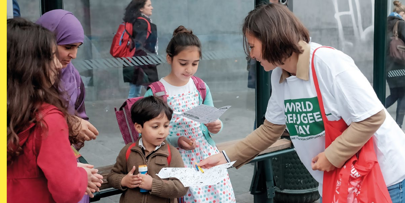
UNHCR in actie tijdens Wereldvluchtelingendag in Brussel.