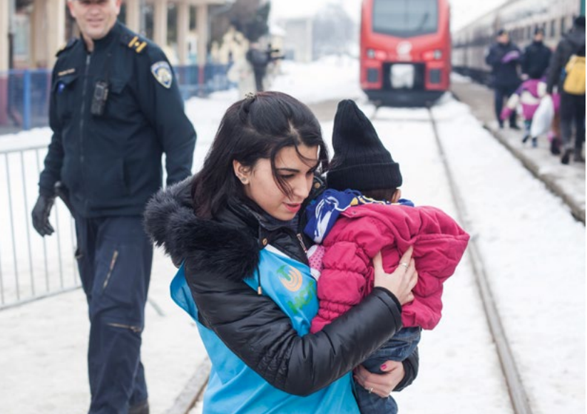
UNHCR personeel in Servië helpt vluchtelingenkinderen in een treinstation.