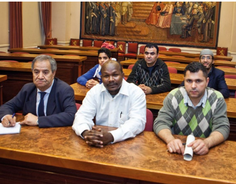
Asielzoekers nemen deel aan een integratiecursus in België en bezoeken het Belgische Parlement terwijl ze leren over de Belgische grondwet.

In ruil moeten vluchtelingen de wetten en regels van het asielland, en de maatregelen om de publieke orde te handhaven respecteren.