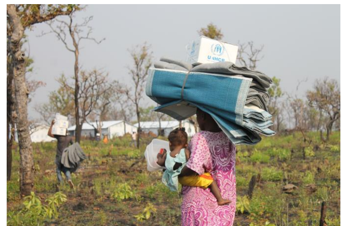
Bens de ajuda humanitária a serem distribuídos, após chegada ao novo assentamento de Lóvua.