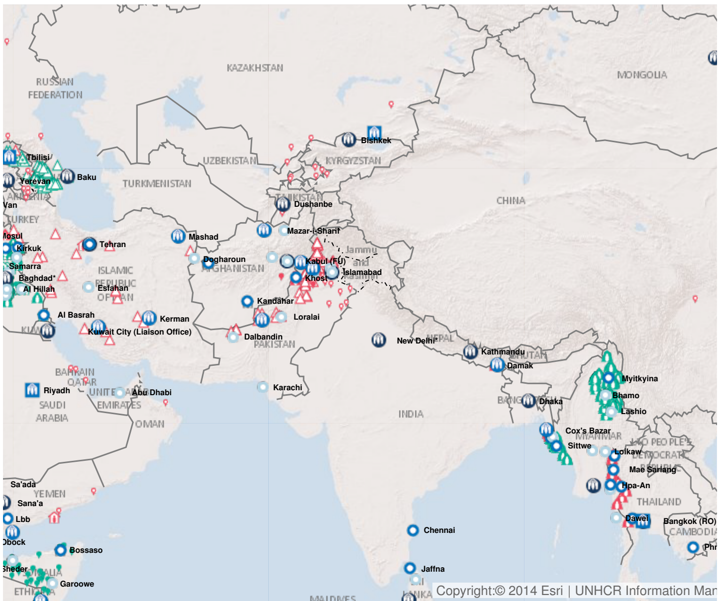
Latest update of camps and office locations 21 Nov 2016.

| Afghanistan | Iran (République islamique d') | Pakistan |