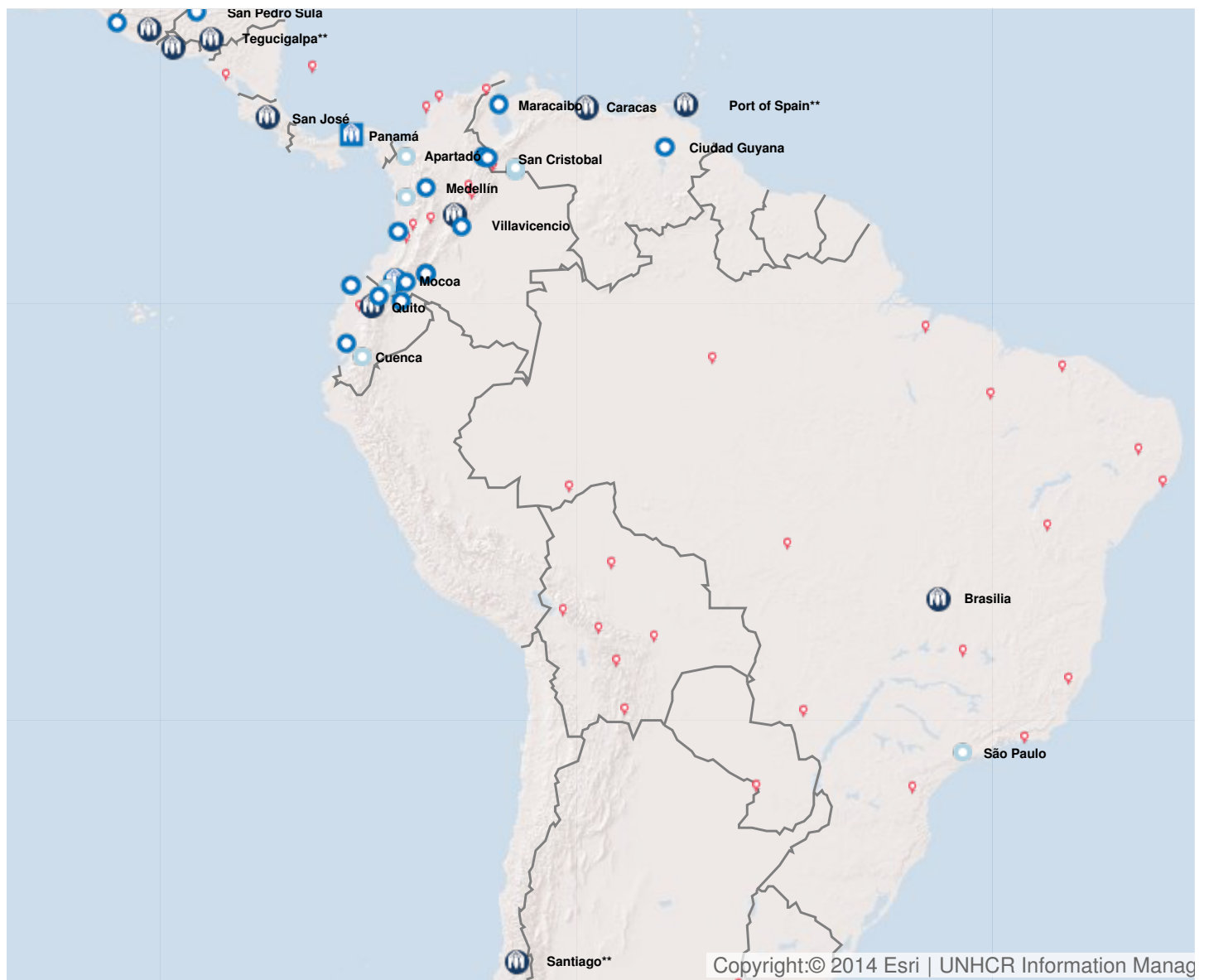
Latest update of camps and office locations 21 Nov 2016 . By clicking on the icons on the map, additional information is displayed.

| Argentine Bolivie (Etat plurinational de) | Brésil | Chili | Colombie | Costa Rica | Cuba | Equateur | Salvador | Guatemala | Honduras | Mexique | Nicaragua | Panama | Paraguay | Pérou | Uruguay | Venezuela (République bolivarienne du) |