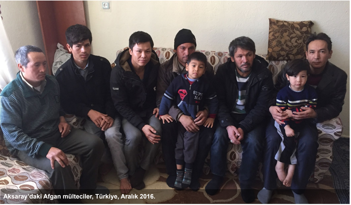
Aksaray'daki Afgan mülteciler, Türkiye, Aralık 2016.