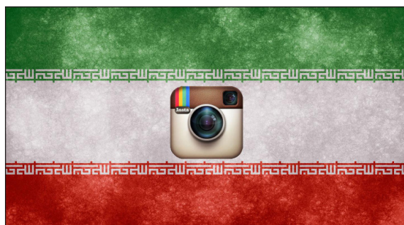
تصویری از اینستاگرام بر روی پرچم ایران. دولت ایران با طرح شکست‌خورده‌ی فیلترینگ هوشمند سعی در سانسور صفحه‌های خاصی از اینستاگرام داشت.

- در ۱۷ اردیبهشت ۱۳۹۴ پژوهشگران اینترنت این فرضیه دولت را رد کردند که حکومت به تکنولوژی پیشرفته‌ای برای فیلترینگ هوشمند در شبکه‌هایی مانند اینستاگرام دست پیدا کرده است. ثابت شد که حکومت فقط توانسته از حذف https (یا رمزنگاری SSL/TLS) برای سانسور صفحات شخصی استفاده کند. حکومت ایران به طور کلی توانایی مسدود کردن صفحات رمزنگاری شده را دارد در حالی که سانسور صفحات شخصی در فیس بوک و اینستاگرام، نیازمند تکنولوژی پیچیده‌تری است که در حال حاضر دولت ایران به آن دسترسی ندارد. این کار، همچنین می‌تواند با همکاری مستقیم با شرکت مورد نظر انجام شود؛ همانطور که توییت‌ها با دولت ترکیه برای سانسور برخی از حساب‌های کاربری ترک‌ها همکاری داشت.