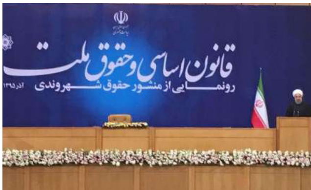
روحانی با رونمایی از منشور حقوق شهروندی در آذر ۱۳۹۵ به یکی از وعده‌های انتخاباتی خود عمل کرد.

ماده ۲۶: هر شهروندی از حق آزادی بیان برخوردار است. این حق باید در چهارچوب حدود مقرر در قانون اعمال شود. شهروندان حق دارند نظرات و اطلاعات راجع به موضوعات مختلف را با استفاده از وسایل ارتباطی آزادانه جست‌وجو، دریافت و منتشر کنند. دولت باید آزادی بیان را به طور خاص در عرصه‌های ارتباطات گروهی و اجتماعی و فضای مجازی از جمله روزنامه، مجله، کتاب، سینما، رادیو، تلویزیون و شبکه‌های اجتماعی و مانند اینها طبق قوانین تضمین کند.