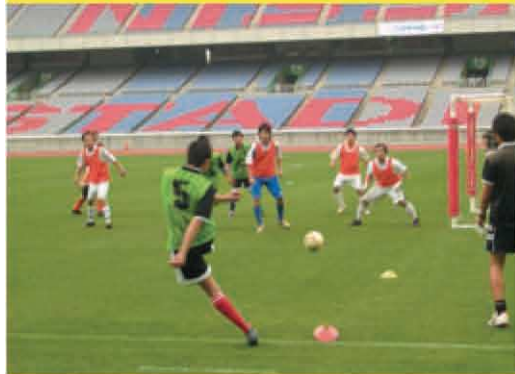
横浜Fマリノスのグラウンドでは、コートを6つに区切り、各コートではそれぞれ白熱した試合が展開された。大会には、選手、観客、ボランティアスタッフを含めて合計約350名が参加した