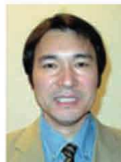
特定非営利活動法人 ワールド・ビジョン・ジャパン 海外事業部長

ワンダと日本の農業類似点や第二次世界大戦から復興の状況等に言及し、ローカル・スタッフと受益者を励ます結果となったからである。またきめ細かいキャパシティー・ビルディングを通じて今まで支援地域で定着しなかった新しい野菜や果物