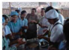
エプロン姿がキュートな参加者、タイのお米はバラバラしているのので、握って焼いて、焼きおにぎりに。