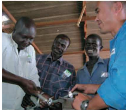
2006年スーダン南部、整備工場のスタッフと作業風景

③カオイダン・難民キャンプなどでは、技術訓練とはいえ、社会性、福祉性を取り入れて、訓練生は、女性および女性を家長とする世帯の人、独居の年少者あるいは高齢者、障害者自身や障害者をもつ世帯の人などを優先した。訓練の効率性だけを考えた場合とは訓練生の採り方が異なる。下肢の動かない障害者難民には、バイク・自動車の電気系統修理を学べる機会を作った（対象ユニットが軽く、上半身の働きで作業できるため）。