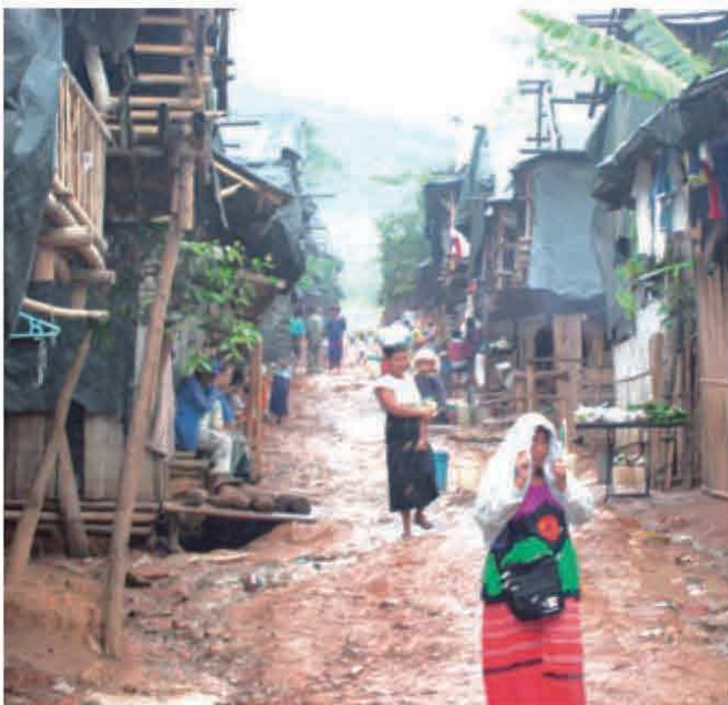
タイ・タムビンキャンプの様子