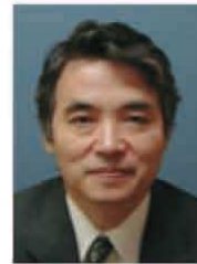
特定非営利活動法人 アジア医師連絡協議会 (AMDA)

AMDAネパール支部はAMDAがUNHCRと連携して行っている世界中の紛争地帯の難民支援活動に医師などを派遣している。例えば、ジブチのソマリア難民支援（1993年～現在）、ルワンダ難民支援、モザンビーク難民や