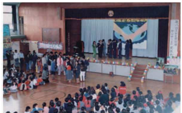
第8回大和定住促進センターとの交流会の様子

RHQにとって1980年代、センターの運営は試行錯誤の時期であったが、ひとつひとつ、地道な努力により問題を解決していった。日本がインドシナ難民の受け入れを開始してから20年以上がたち、現在、1万人以上のインドシナ難民が定住している。しかし、定住する難民はいまだに多くの問題を抱えている。RHQは、難民が直面している問題に今でもひとつひとつ解決する努力を続けているところである。