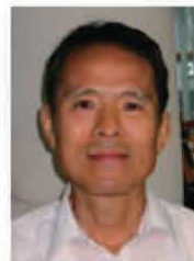
特定非営利活動法人 ブリッジ エーシア ジャパン 事務局長