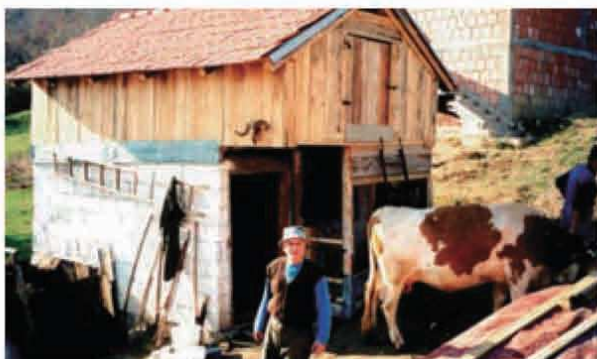
JENの家畜小屋提供事業

JEN風支援活動の全てを通じて、①自立支援、②平和構築、③平等・等価値のアプローチ、④生活実感としての改善、⑤多目的なアプローチ、⑥ネットワークの活用、などの味付けが施されている。これら全ての味付けが持続可能性を追求し、人間の安全保障を高