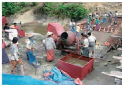
マウンドーでの橋梁建設の様子。女性もOJTに参加

地域のインフラが整備されていない地域では、住民参加型のインフラ整備で、参加する住民にも食糧やお金が入るようにして、地域経済を活性化することは有効な手段である。南部地域では、橋や栈橋ができると幹線道路沿い