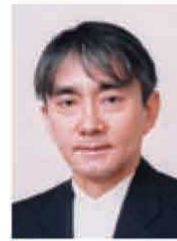
特定非営利活動法人 日本国際ボランティアセンター 代表理事