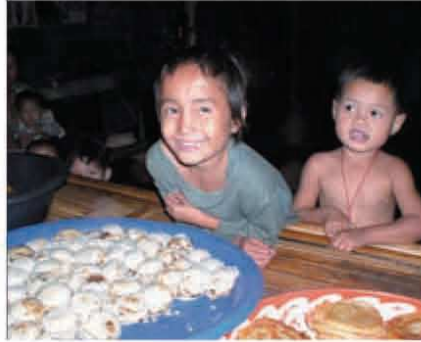
タイ・タムビンキャンプの子供たち

レシピは、食材と調理方法で決まる。難民支援の最前線で活動するNGOにとって食材とは、予算や人員・体制、機材・装備や現地の政治・治安状況等の活動条件だろう。もちろん良い食材があるにこしたことはないが、限られた食材でも調理の工夫次第では美味しい料理ができる。料理人の腕の見せ所であろう。そして国連の中立性が求められるUNHCR日本人職員は、独自のレシピを編み出すというより、NGOのレシピを一緒になって美味しい料理として表現する役割を担っている。その