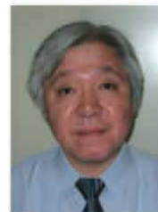
アジア福祉教育財団 難民事業本部

他方、RHQはセンター内での問題も抱えていた。姫路定住促進センターと大和定住促進センターは、共にインドシナ難民3カ国人（民族）のうち複数の国籍の難民を同時に受け入れていた。狭小なセンター敷地の居住区域の中で6カ月以上の共同生活を営むなかで、些細なことからトラブルがよく発生した。インドシナ半島という比較的小さな地域を同一にするとはいえ3カ国の人達はそれぞれ言語、宗教、文化、気質が違い、且つ3国間の民族的・地理的・歴史的ともいえる抗争などの経緯