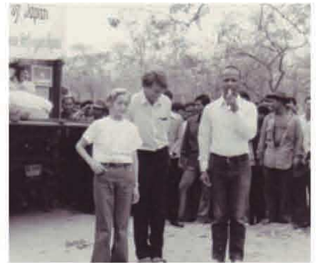
*80 タイ・カンボジア国境にて。日本から20万枚の衣料を送る

を拡大した。ポシェット運動や、毛布を送る運動は立正佼成会やガールスカウト日本連盟などにも協力頂き、それぞれが独自に引き続き実施している。