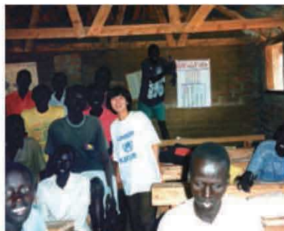
小学7年生のクラスにて

これは高校卒業時の先生の言葉だ。難民キャンプに行ってから約10年を振り返り、まさにキャンプ・サダコは私の人生への大きな賜物であったと言える。なぜなら、難民の不条理に気づき、いかにして解決すべきかという人生の大きなテーマを得ることができたからだ。そのテーマに向かってキャンプ・サダコ卒業生の多くがそれぞれの立場で奮闘していることであろう。私達にとってキャンプ・サダコは、人生を確実に良い方向に変える機会だったと思う。