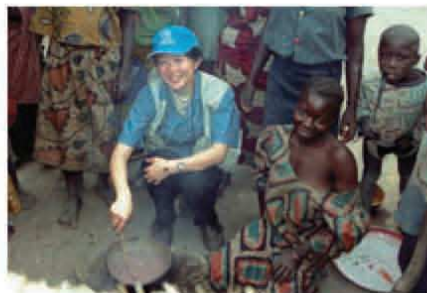
2001年、UNHCRベトナム事務所(コンゴ共和国)でコンゴ民主共和国からの難民のレジストレーション・サイトに

れていたが、配水所の建設などまだまだ時間がかかりそうだ。キャンプへの道も雨季のため、修理しても泥沼の状態に戻り、全く効果なし。食糧輸送のトラックがどうやってここを通ることができる？期待していたほどの進展はなく、がっかりする。首都のキンシャサ事務所が「緒方高等弁務官が6月にキャンプに訪問するし、それまでには難民を5000人キャンプへ移動してほしい」とプレッシャーをかけてくるのだが、そんなことは現実的に無理！キンベセのUNHCRスタッフは私と運転手だけで、パートナー団体のおかげで何とかオペレーションが進んでいるようなものなのだ。仮住まいの難民への支援、難民のキャンプへの移動の計画づくり、アンゴラ国境に住む人々への難民キャンプに関する情報提供の上に、キンベセの北部にいた、コンゴ共和国難民の陸路による帰還にも多少かわって、身も心もフラフラ。そんな話をコンゴ人の同僚に話すと「この国は大体、ルワンダ、ブルンジ、コンゴ共和国、そしてアンゴラからの難民、そしてコンゴ人難民の帰還で、何年も緊急事態に振り回されていて、皆疲れているよ」と言われてしまった。