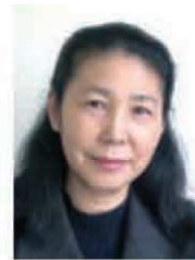
認定NPO法人 難民を助ける会 理事長

会は、アフリカでの飢餓救援にも力を注ごうと、創立5周年記念総会で名称を「難民を助ける会」に変更した。難民への眼鏡・衣料品・医薬品の提供、パンと牛乳の節食ランチ募金を行い、アフリカに毛布をおくる運動を提唱し中心的な役割を担い、手作りの布製の巾着袋に生活用品をつめて難民キャンプの子どもたちに配布する「愛のポシェット運動」など、ユニークで先駆的な活動を展開し、「守備範囲」