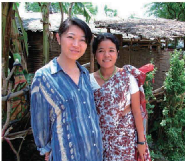
ネパールの難民キャンプにて、難民女性リーダーと

1963年生まれ。東京大学法学部卒。テレビ局入社後にコロンビア大学大学院へ留学。JPOでUNHCRトルコ事務所に赴任。その後、プリンジ、コソボ、ジュネーブ本部での勤務を経て、国連世界食糧計画(WFP)日本事務所へ出向。現在はUNHCRネパール・ダマク フィールド事務所所長。