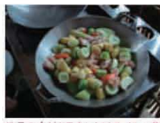
地元の食材と日本レシピで、カレン族ふう肉じゃが。