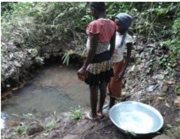
Source de Noufou avant aménagement

La source aménageable la plus proche du village est à 1,5 kilomètre. Elle comporte 8 émergences avec un débit de 15L/min.