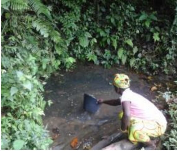
Source de Dankobéla avant aménagement

La source de Dankobéla est située à environ 1km des premières habitations, et à 3 km du centre du village de Godawa, mais est la seule source aménageable, la plus proche du village. Elle comporte 8 émergences pour un débit de 20L/min.