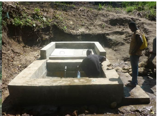
Source de Noufou aménagée

Le forage est situé dans le village. La margelle a été reprise dans sa totalité, l'ancien corps de pompe réinstallée (cote d'installation à 35 mètre, pour une profondeur de 59 mètres et un niveau statique à