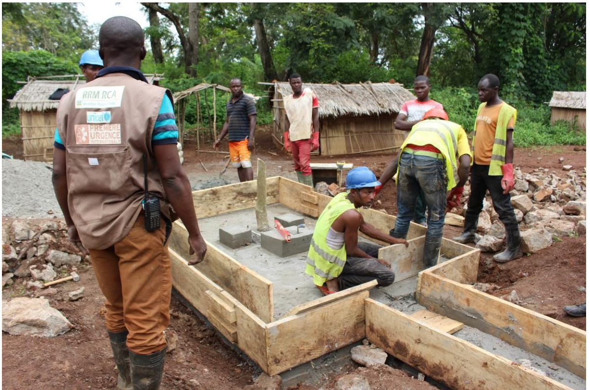
Réhabilitation forage à Noufou le 22/09/2016