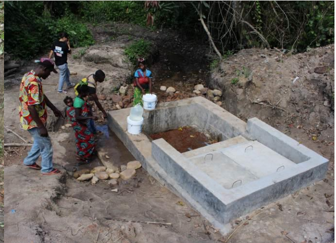
source de Ngam-Ngam aménagée

Le forage est au centre du village, équipé d'une pompe à pied HPV 60. Il était non fonctionnel depuis 2014.