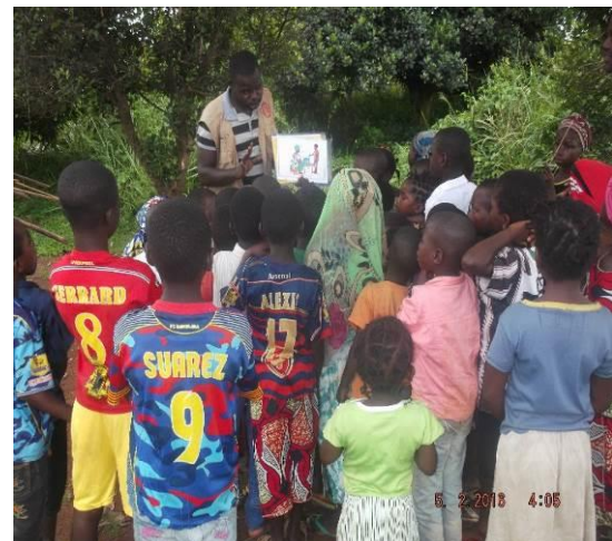
Focus Groupe, Ngam-Ngam, Godawa, Noufou, Beina 2, Septembre 2016