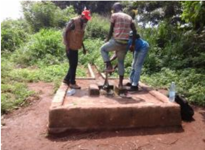
Forage de Béina 2 avant travaux

Le forage, situé dans la localité, était non fonctionnelle. Après les travaux de démolition/construction de la margelle et puits perdu, l'ancienne pompe a été réinstallée (avec une cote d'installation à 35 mètres, pour une profondeur de 48 mètres et un niveau statique de 21 mètres), mais avec un kit pédale neuf.