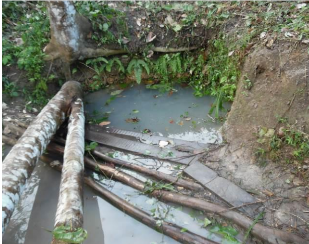
source de Ngam-Ngam avant aménagement

La source est située à environ 800 m du centre du village, et comptabilise 4 émergences avec un débit environ 20L/min.