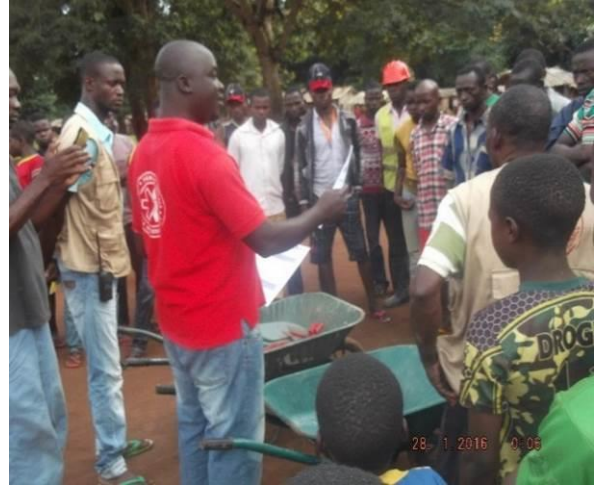
Remise des kits d'entretien des points d'eau à Ngam-Ngam, Dankobela, Godawa, Beina 2 et Noufou, Septembre 2016