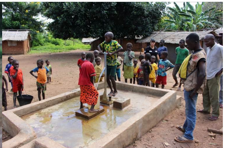
Forage réhabilité à Ngam-Ngam