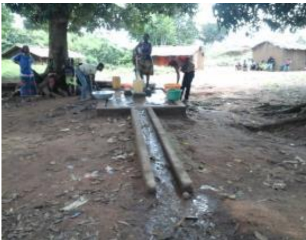
Forage de Godawa avant réhabilitation

Le forage est situé au cœur de la localité. La margelle, très abimée, a été reprise dans sa totalité. Après travaux l'ancienne pompe a été réinstallée (cote d'installation est de 34 mètres, pour une profondeur de 45 mètres et un niveau statique à 18,40 mètres), seule la pédale a été changée.