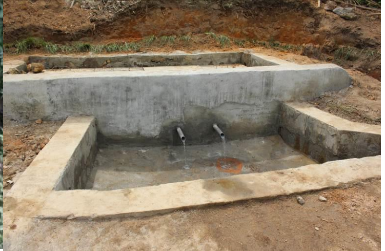
Source de Dankobéla aménagée

Le forage est situé au cœur de la localité. La margelle, très abimée, a été reprise dans sa totalité. Après travaux l'ancienne pompe a été réinstallée (cote d'installation est de 34 mètres, pour une profondeur de 45 mètres et un niveau statique à 18,40 mètres), seule la pédale a été changée.