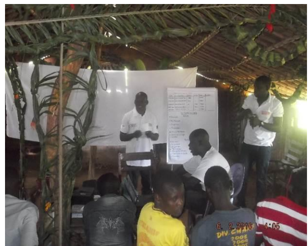
Formation des RECO, Ngam-Ngam, Godawa, Dankobela, Noufou, Beina 2, Septembre 2016