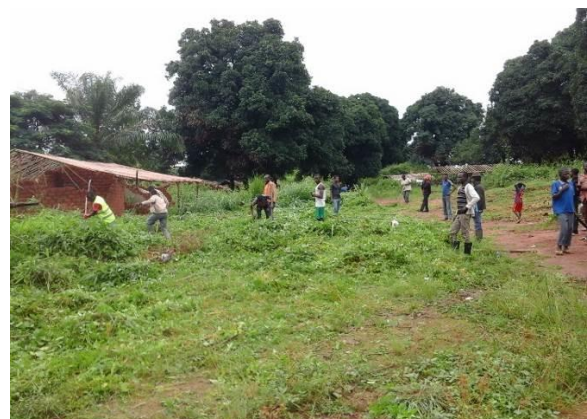
Sensibilisation de masse, Ngam-Ngam et Beina 2, Septembre 2016