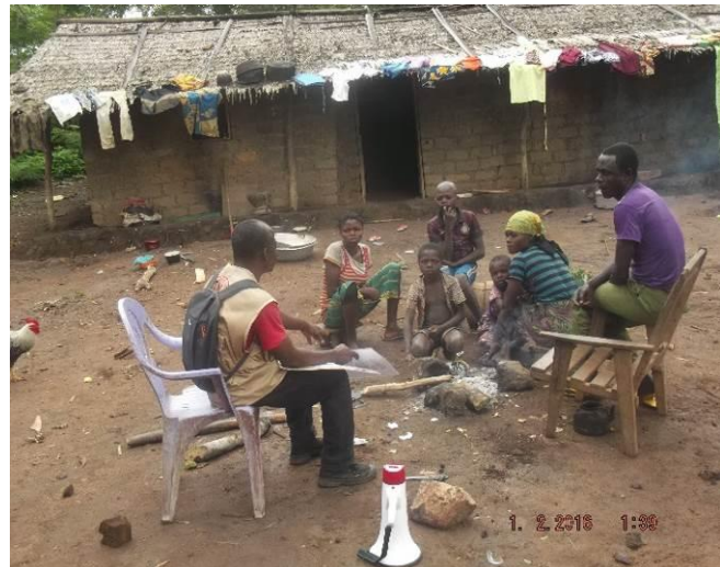
Sensibilisation Porte par Porte, Ngam-Ngam, Godawa, Dankobela, Noufou, Beina 2, Septembre 2016