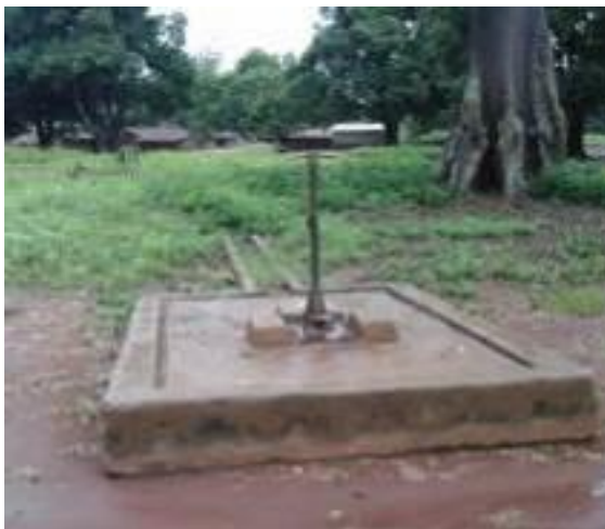
Forage avant réhabilitation à Ngam-Ngam

La margelle a été reprise dans sa totalité avec construction d'un puits perdu. Une nouvelle fontaine a été installée, et les tuyaux de refoulement et pédale changé (la coté d'installation est à 38 mètres pour une profondeur de 56 mètres et un niveau statique à 10,40 mètres).