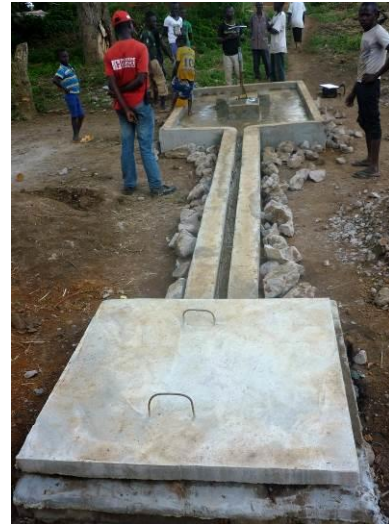
Forage de Beïna 2 réhabilité