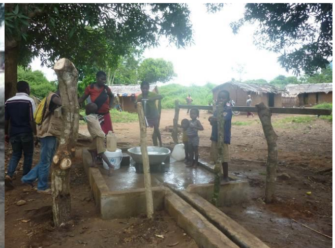
Forage Godawa réhabilité