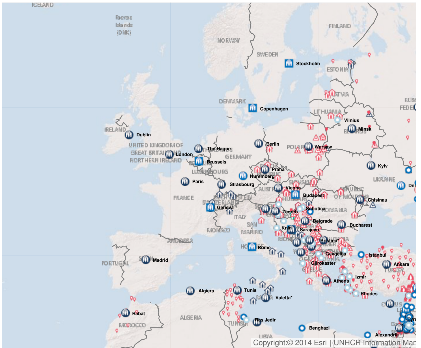
Latest update of camps and office locations 13 Jan 2016 . By clicking on the icons on the map, additional information is displayed.

| Albanie | Allemagne | Andorre | Autriche | Belgique | Bulgarie | Croatie | Chypre | Danemark | Espagne | Estonie | Finlande | France | Grèce | Saint-Siège | Hongrie | Irlande | Islande | Italie | Lettonie | Liechtenstein | Lituanie | Luxembourg | Malte | Monaco | Norvège | Pays-Bas | Pologne | Portugal | République tchèque | Roumanie | Royaume-Uni | Saint-Marin | Slovaquie | Slovénie | Suède | Suisse |