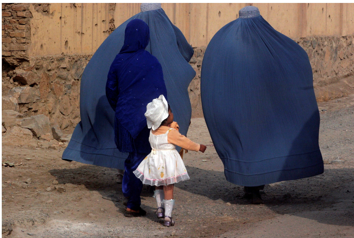
Afghanistan Personnes déplacées internes à Kaboul.