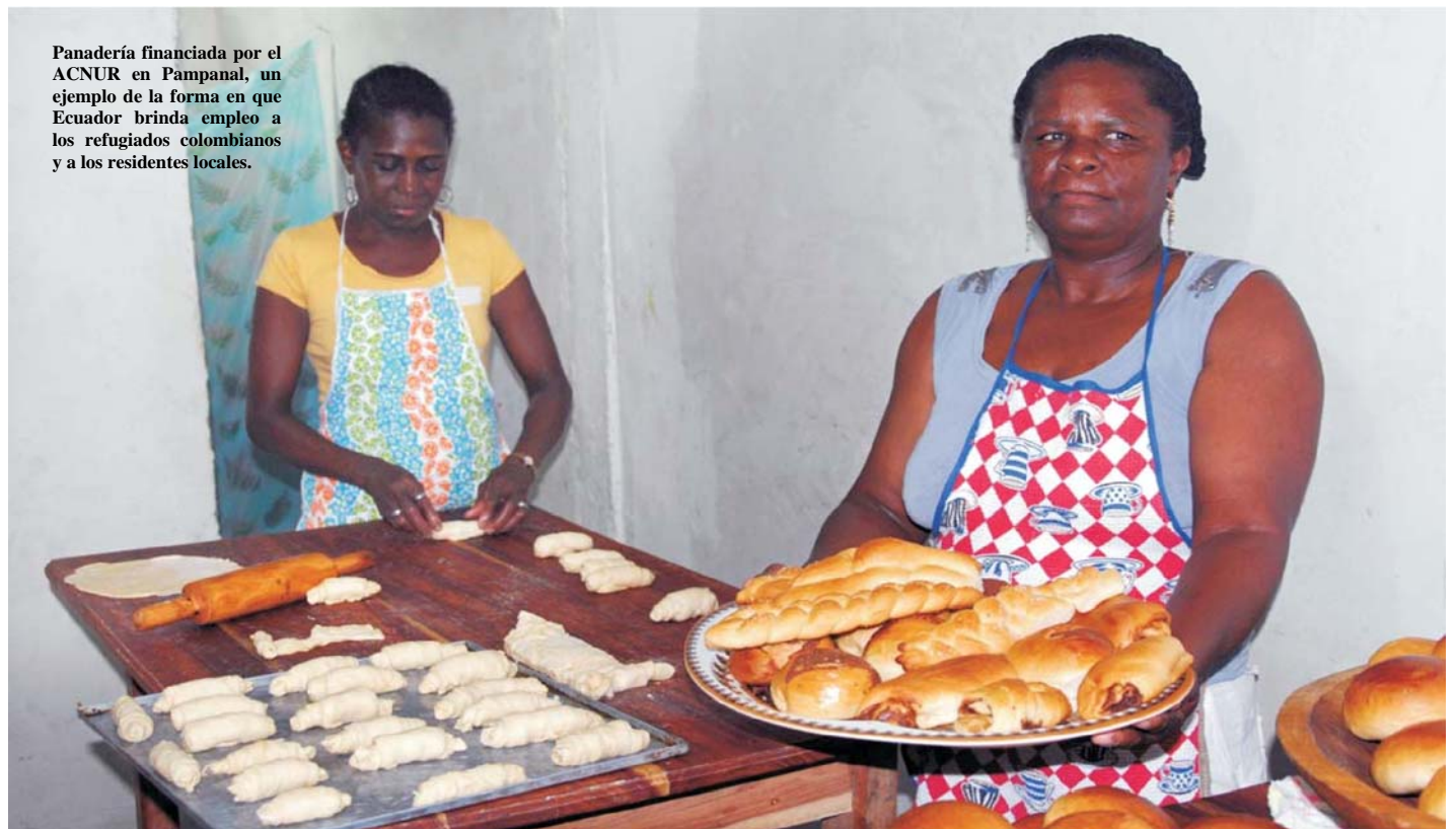
Panadería financiada por el ACNUR en Pampanal, un ejemplo de la forma en que Ecuador brinda empleo a los refugiados colombianos y a los residentes locales.