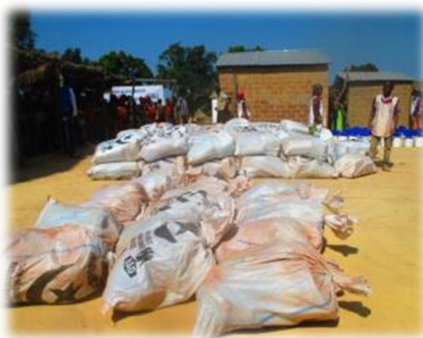
Vue d'installation des kits sur le site de distribution NFIs à Doko