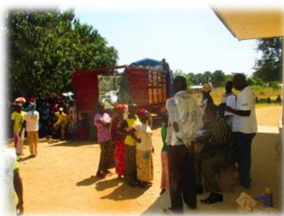
L'équipe ACF/RRM assistée d'un chef de groupement pour la validation des bénéficiaires lors de l'emargement à l'école d'application de Bocaranga.