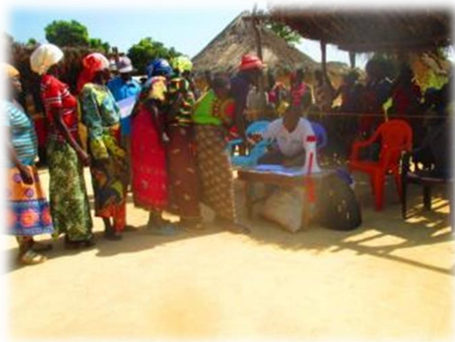
Emargement des bénéficiaires à Doko