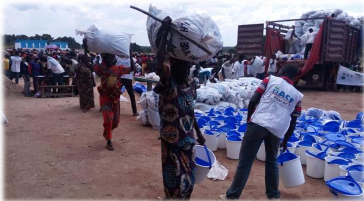
Vue de site de la distribution NFIs de Bomari2

Préfecture de Ouaham-Pendé Sous-Préfectures de Bocaranga et une partie de Ngaoundaye