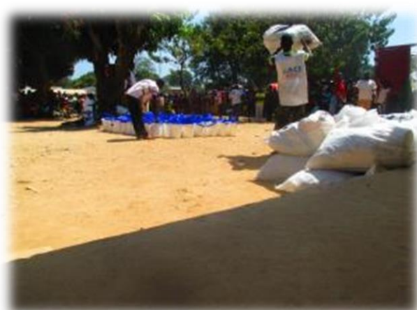
Vue d'un ménage servi lors de la distribution de kits NFI à l'école d'application de Bocaranga.