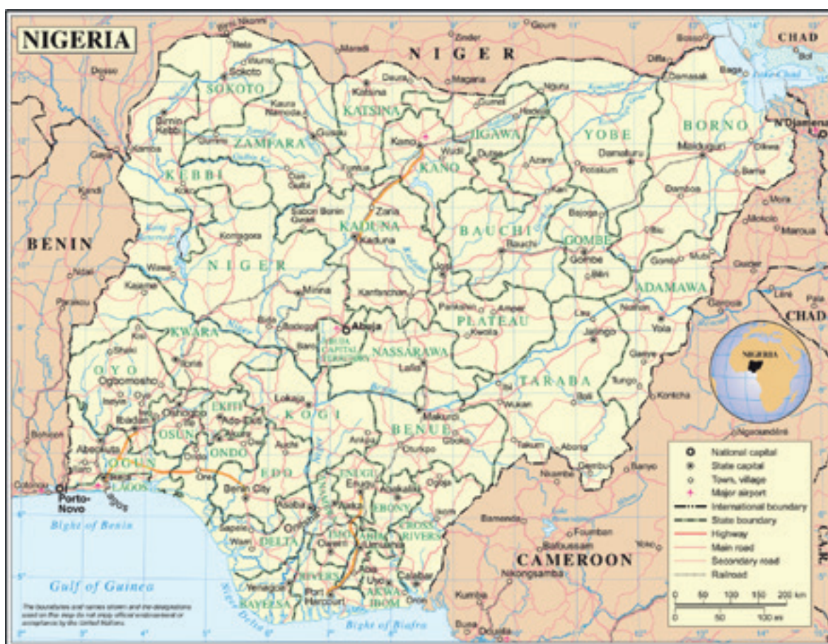
Carte n° 4228 des Nations unies, Rev. 1, août 2014 (16) .