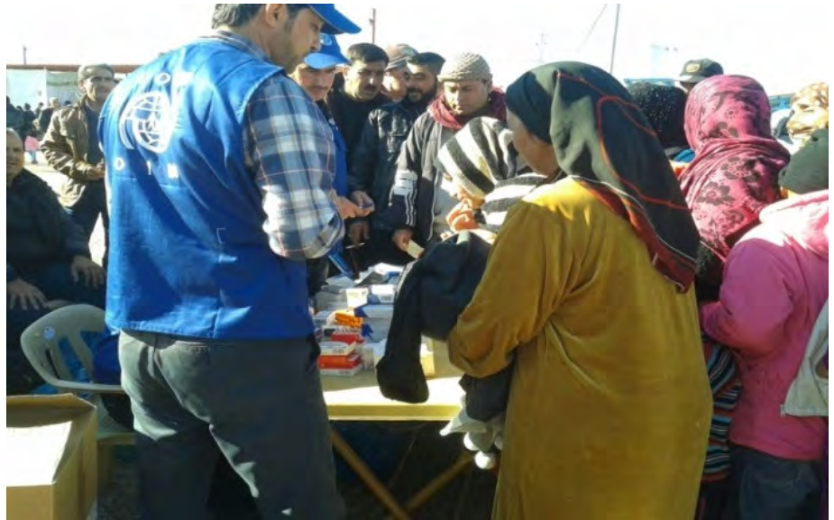
توزيع الأدوية في مخيم گاويلان - المفوضية