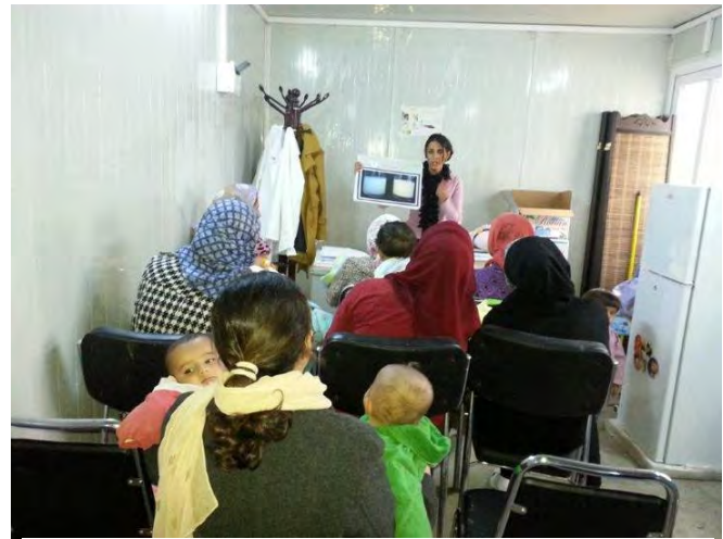
ندوة أقامتها اليونيسيف للنساء الحوامل والمرضعات في مخيم كويرجوسك - اليونيسيف