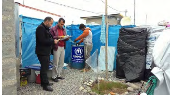
توزيع مادة النفط في مخيم دوميز - المفوضية