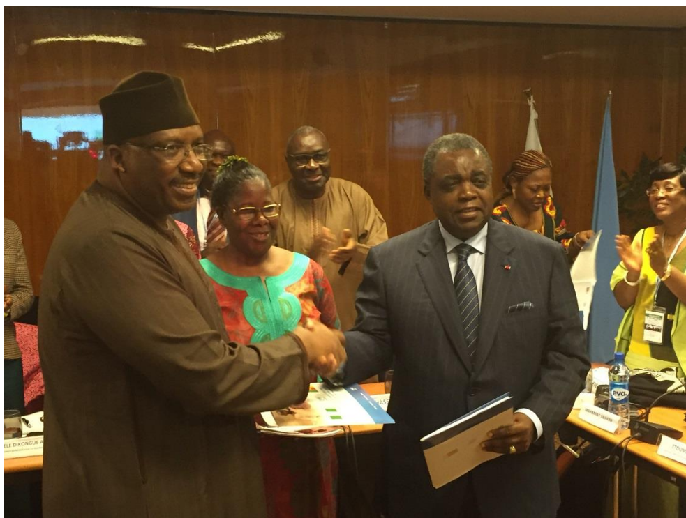
Echange de parapheurs entre M. Abdulrahman Bello Dambazau, Ministre de l'Intérieur nigérian, M. René Emmanuel Sadi, Ministre de l'Administration Territoriale et de la Décentralisation.