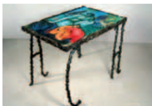
Sandro Chia - C.H.I.A 2006 tavolo-scultura in bronzo, piano decorato con gessetti colorati cm70x100x80