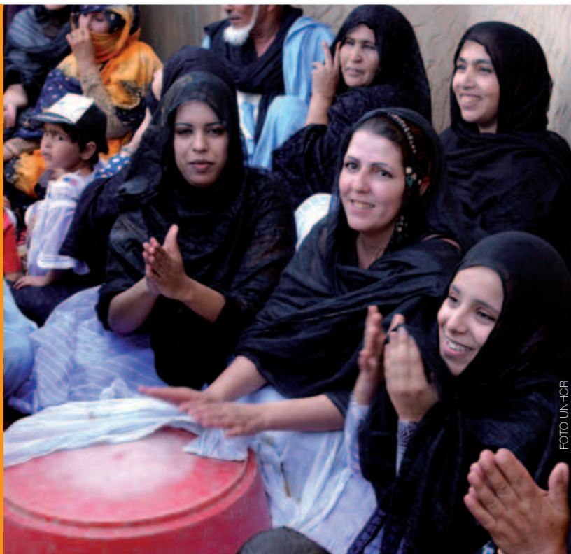
Donne Sahrawi che cantano e suonano, felici di incontrare dopo quasi trent'anni alcuni membri delle proprie famiglie.