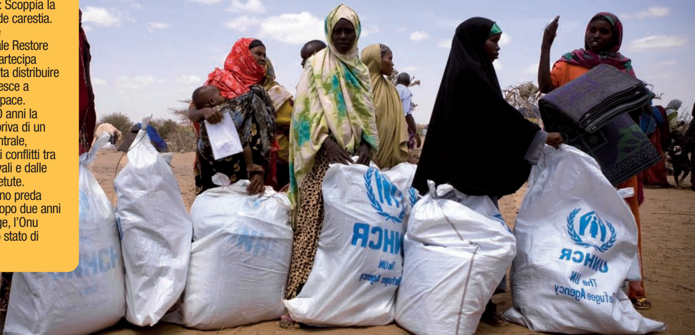
Distribuzione di cibo nel centro di transito di Kabasa