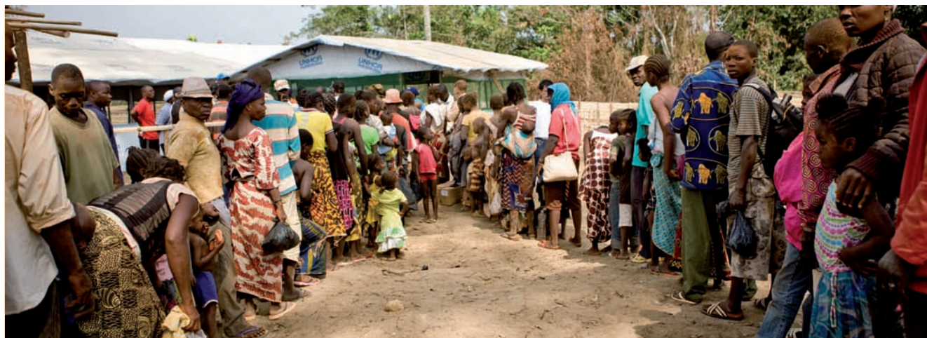
Campo di Bahn in Liberia: rifugiati ivoriani aspettano di essere registrati.

packaging e stoccaggio. La Fondazione IKEA ha l'obiettivo di dare ai bambini e ai giovani rifugiati l'opportunità di appropriarsi del proprio futuro attraverso il finanziamento di programmi che creino mutamenti sostanziali e duraturi.