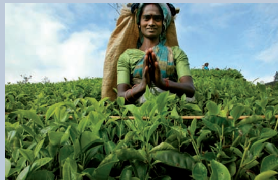
Portati dai britannici durante la colonizzazione gli indiani in Sri Lanka si sono trovati apolidi dopo aver vissuto sull'isola per due generazioni

Uno dei compiti che rientra nel mandato dell'UNHCR è quello di prevenire e contrastare a livello globale il grave fenomeno dell'apolidia. Un problema di cui si sente poco parlare, anche per l'indeterminatezza giuridica che lo caratterizza, ma che riguarda oggi 12 milioni di persone nel mondo: uomini, donne e bambini privi di nazionalità, che nessuno Stato ha riconosciuto come cittadini. Vivere senza uno dei diritti umani fondamentali, la cittadinanza, determina una condizione precaria e pericolosa, che genera una spirale di esclusione sociale. Gli apolidi, sprovvisti di regolari documenti di