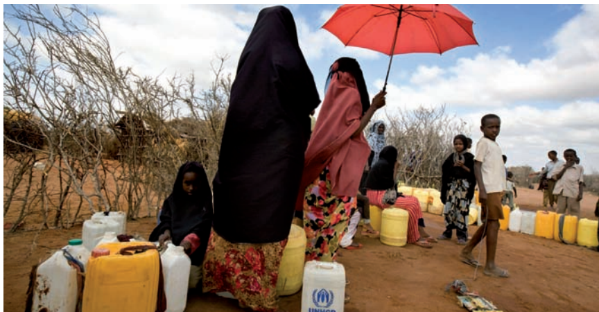
Dadaab: donne e bambini in coda per l'acqua sotto il sole.

«Questo gesto umanitario – ha dichiarato l'Alto Commissario per i Rifugiati António Guterres – giunge in un momento particolarmente critico. La crisi nel Corno d'Africa continua ad aggravarsi, con migliaia di persone che continuano a fuggire dalla Somalia ogni settimana». Dadaab è stato aperto per accogliere 90.000 persone. Ma negli ultimi anni i numeri sono cambiati: il conflitto, la siccità e la carestia nella vicina Somalia vi hanno portato circa 440.000 rifugiati, 152.000 negli