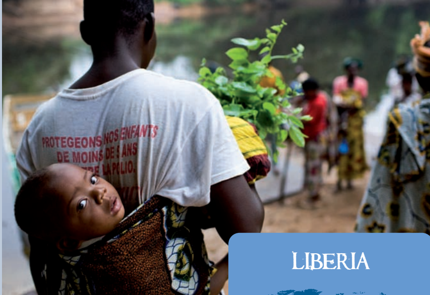
in viaggio verso il fiume al confine tra Liberia e Costa d'Avorio