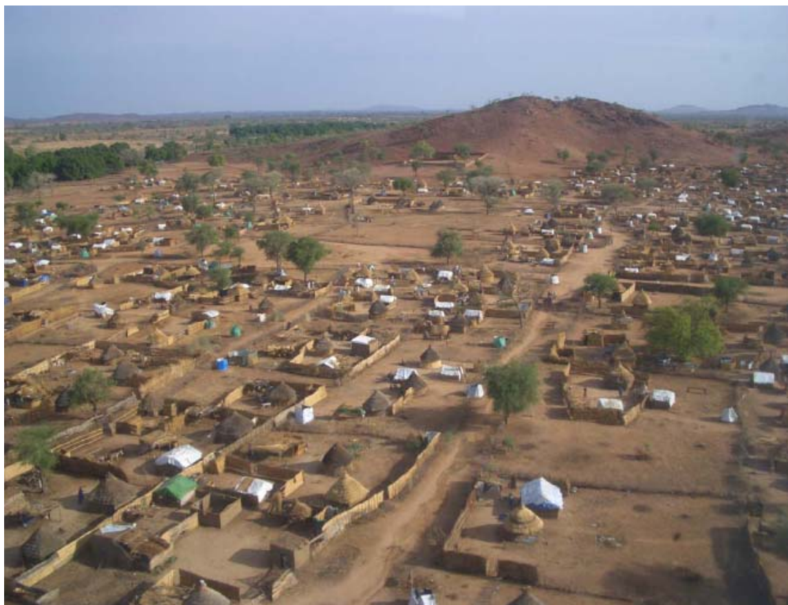
Vue aérienne du camp des PDI de Mornei