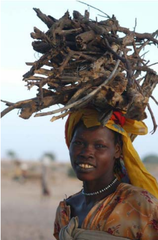
Une PDI qui emporte du bois de chauffage, camp Manjura

Dans la région ouest du Darfour, l'UNHCR préside le Groupe de travail sur la Protection dans le cadre duquel sont coordonnés et accrus les efforts de protection des agences opérant dans la région. L'UNHCR co-préside avec le FNUAP le Groupe de travail sur les Violences Sexuelles et Sexistes.