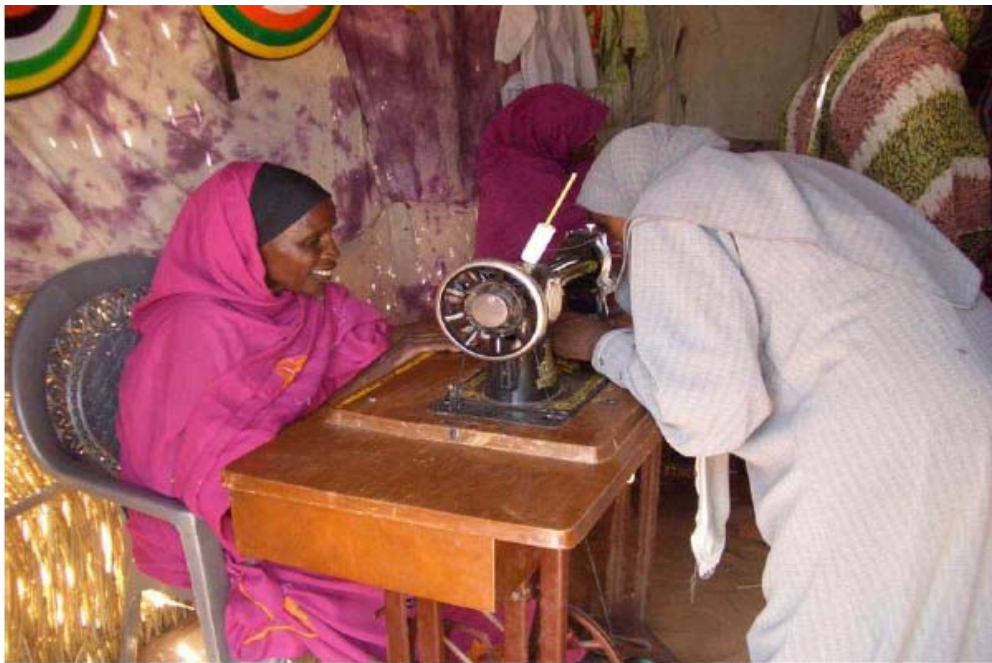
Le centre des femmes, camp des PDI de Riyad