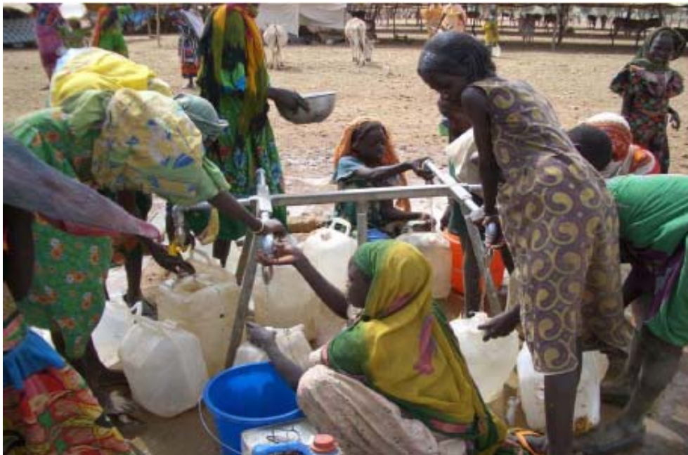
Point d'eau au camp de réfugiés d'Um Shalaya