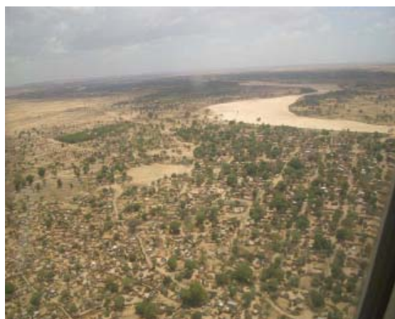
Vue aérienne d'El Geneina

Un autre obstacle est le manque général d'infrastructures. Pendant la saison des pluies certaines zones sont totalement inaccessibles à cause de l'état de détérioration des routes.